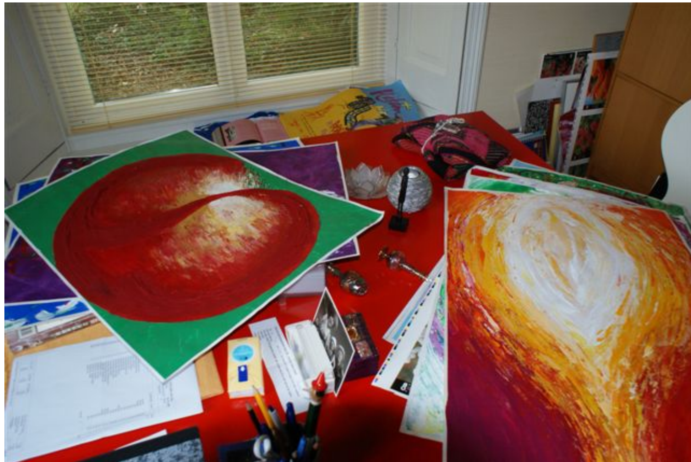
Mijn initialen cs.