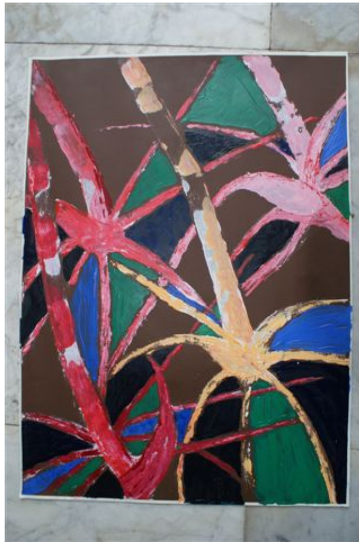
Een detail uit een zwart-wit foto groot uitgewerkt.