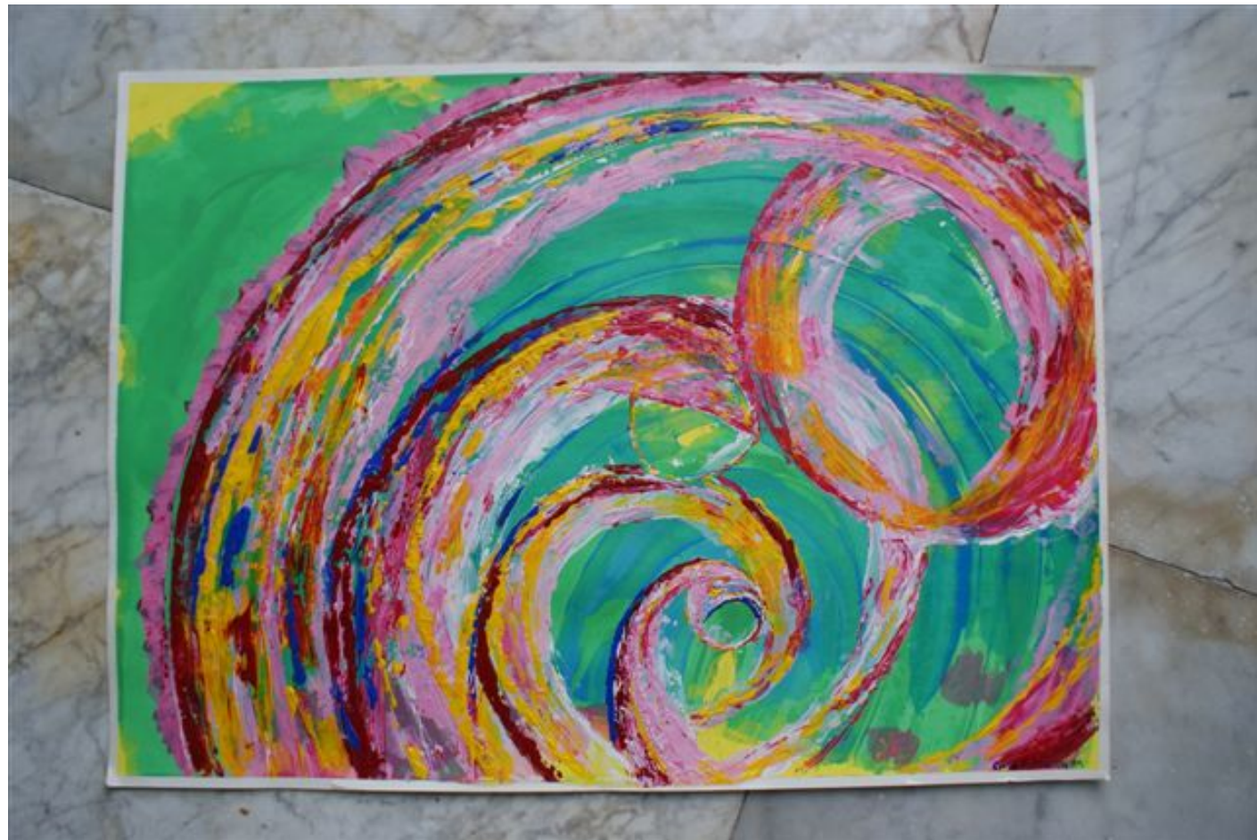
Moeder en kind.