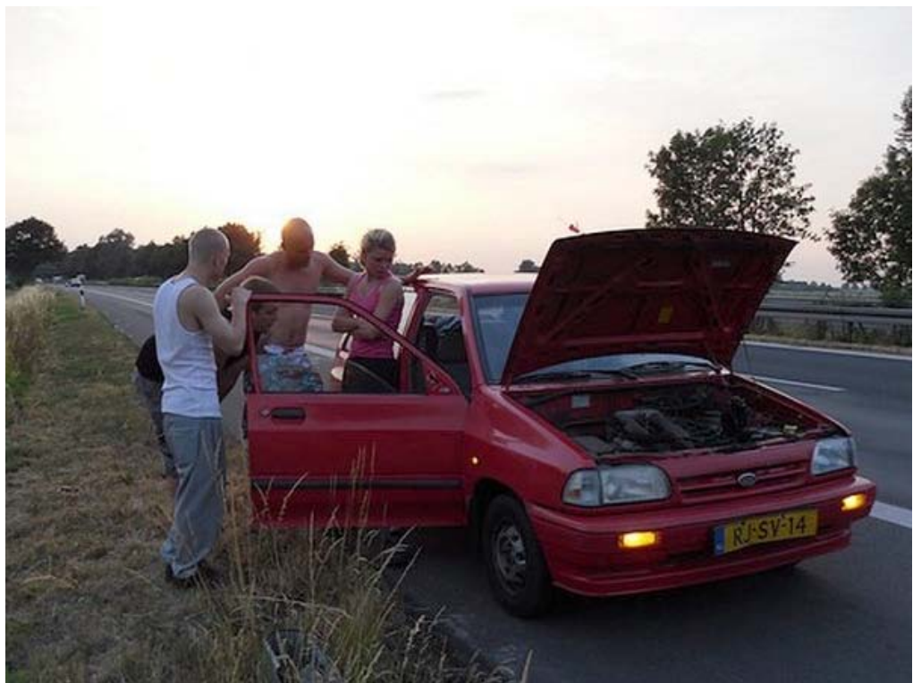
Onderweg werden ze nog wel even geplaagd door pech maar het was en het bleef een zeer geslaagde vakantie!

Onze site wordt mede mogelijk gemaakt door: