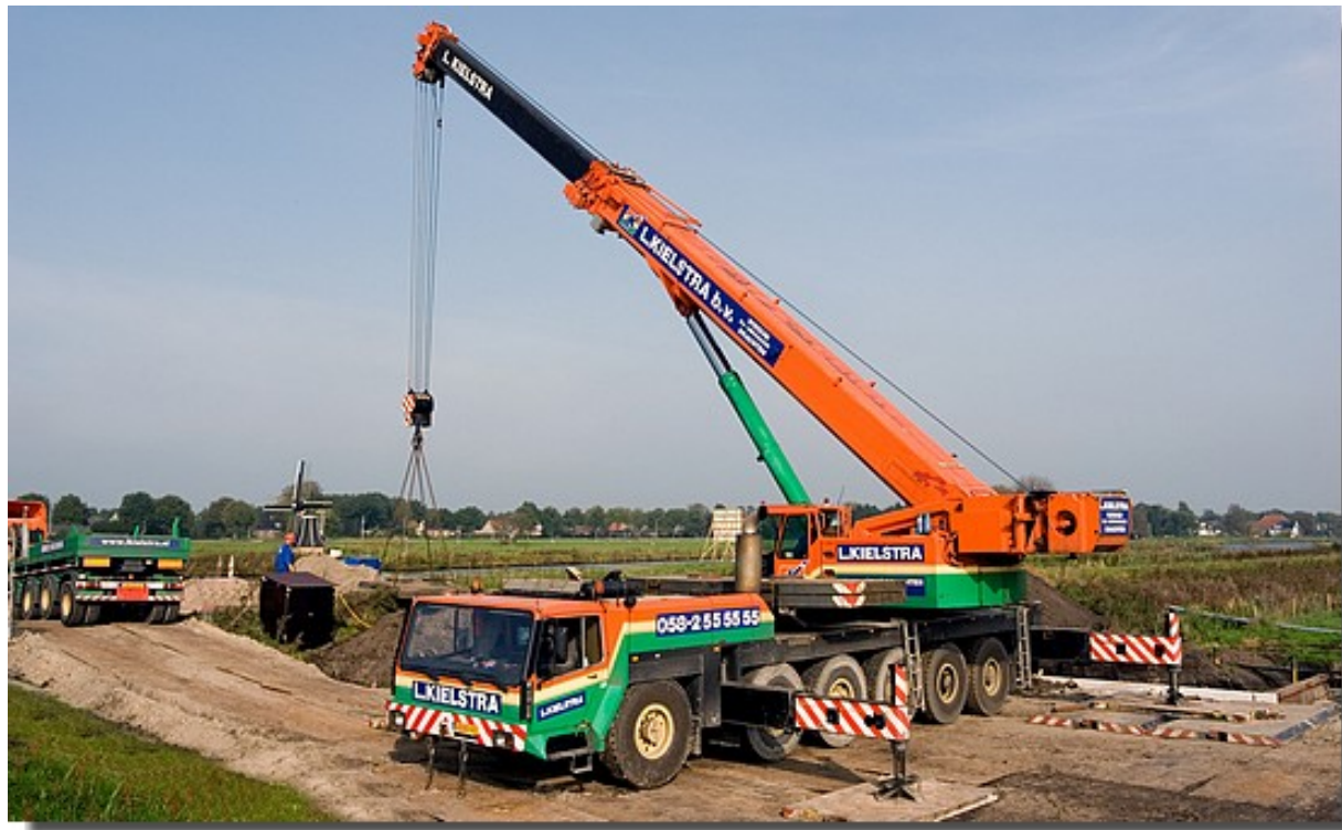
Plaatsen betonnen prefab kelders voor gemalen. Gewicht ca 50 ton. Kraan LTM 1160, 160 tonner met ballastwagen. Locatie Mildam.