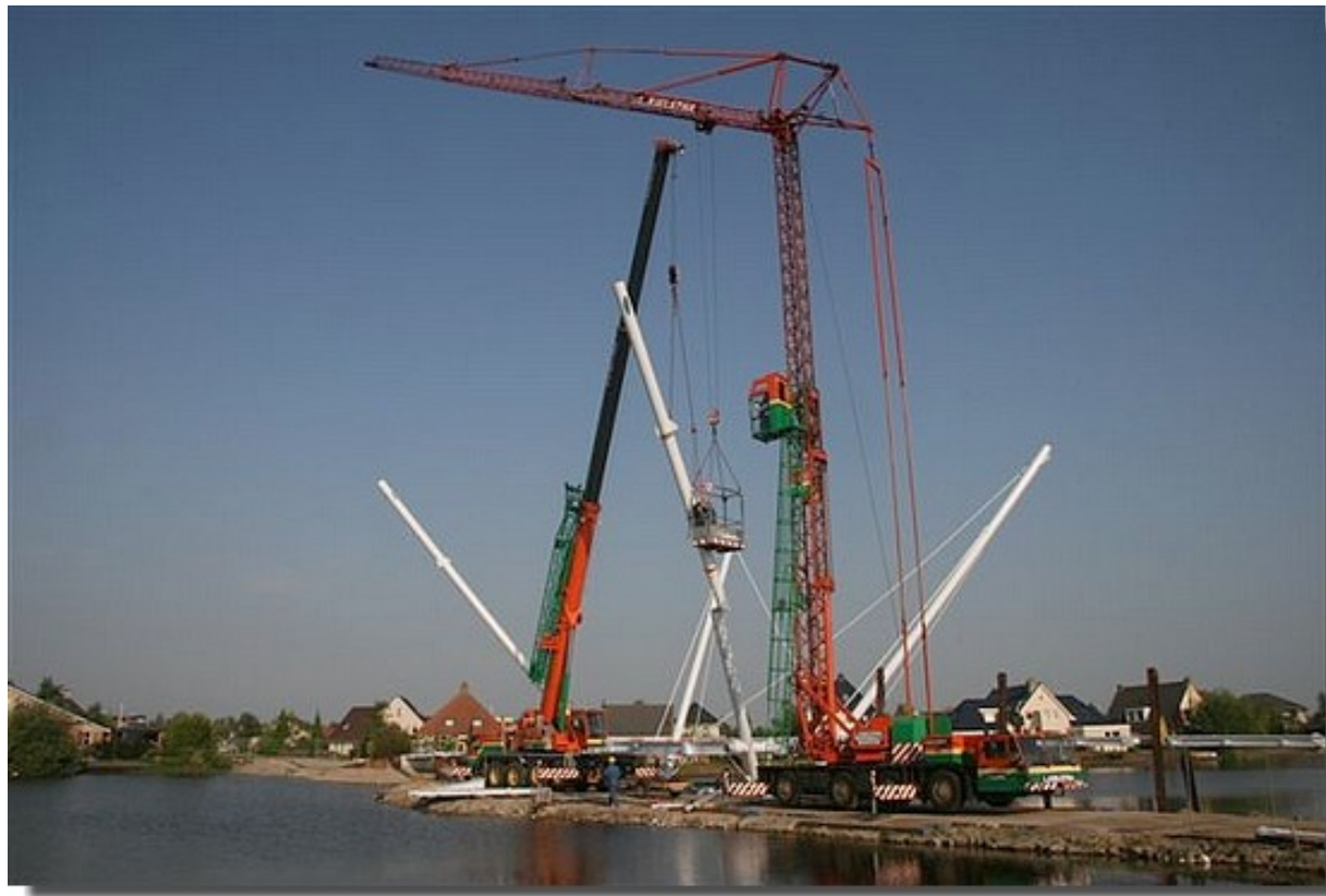
Montage stalen brug te Joure. Kranen 70 tons Faun en een Spierings SK477 38m. Opdrachtgever Nijholt staal en machinebouw Heerenveen.