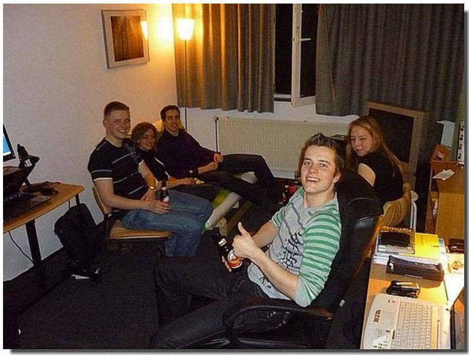
Het gezellig samen zijn, wat tot in de late uurtjes duurt.