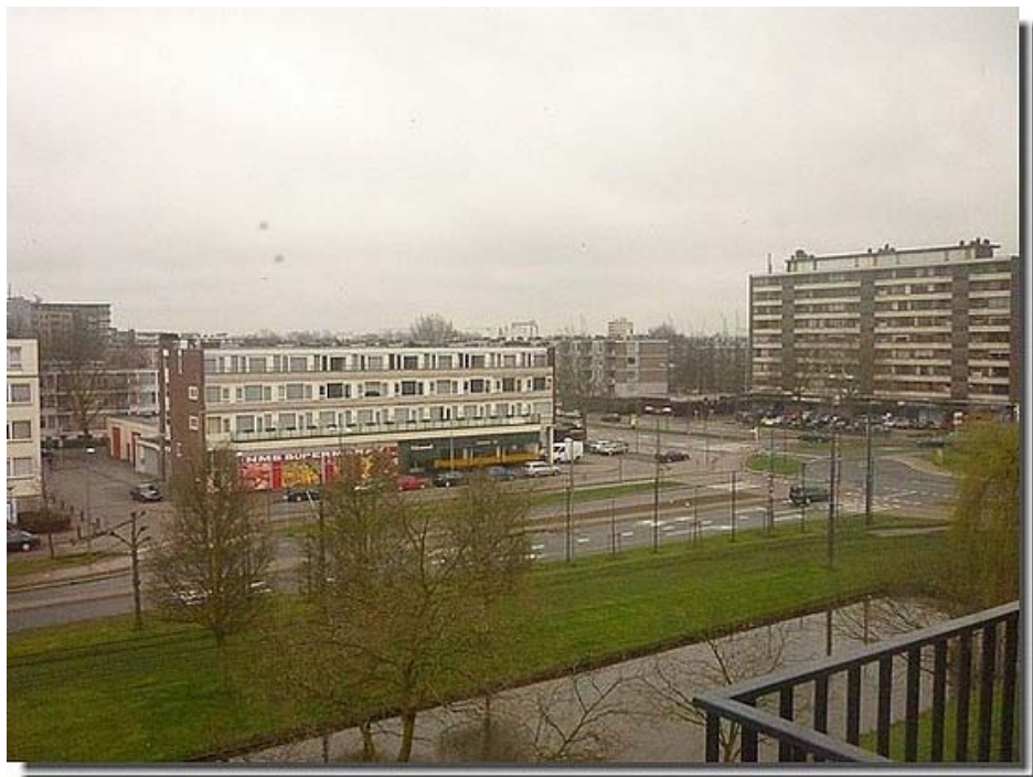
Het uitzicht vanuit de woonkamer