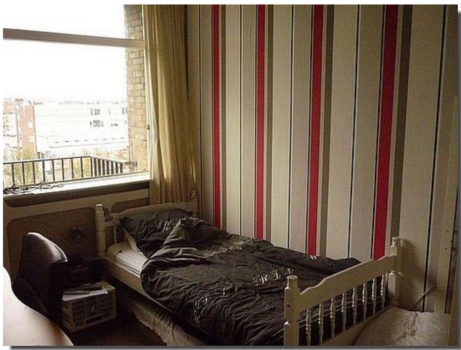
Hier de slaapkamer waar een drukke student zijn roes kan uitslapen.