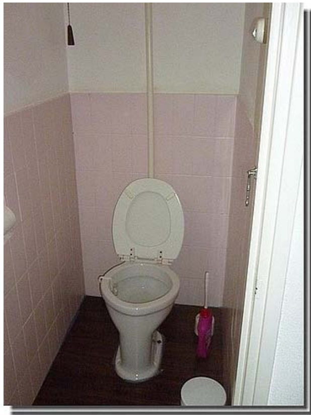
Een mooi roze gekleurde wc.