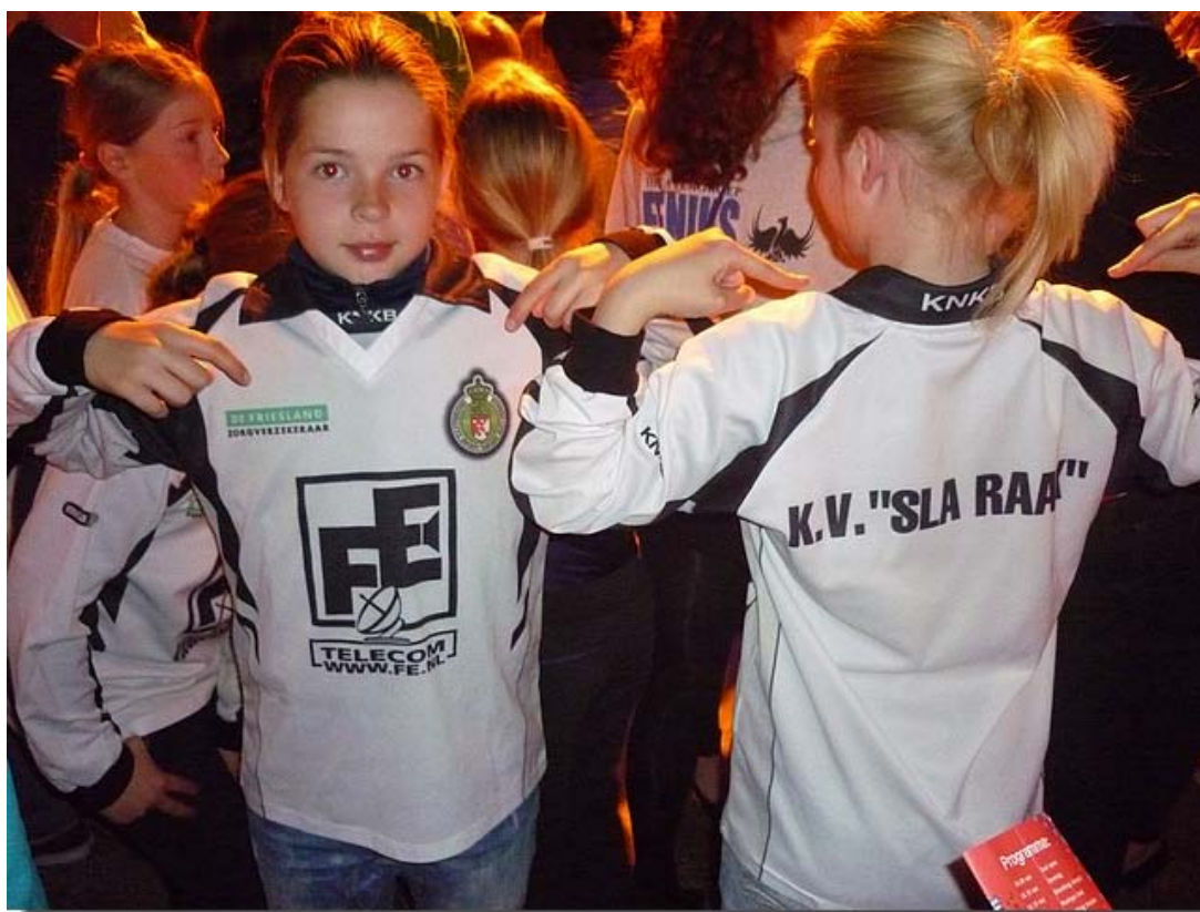
De jeugdleden waren allemaal gekleed in verenigingstenue, de nieuwe d.e.l. (door elkaar loten) shirts die vorig jaar beschikbaar zijn gesteld door FE Geluidsproducties.