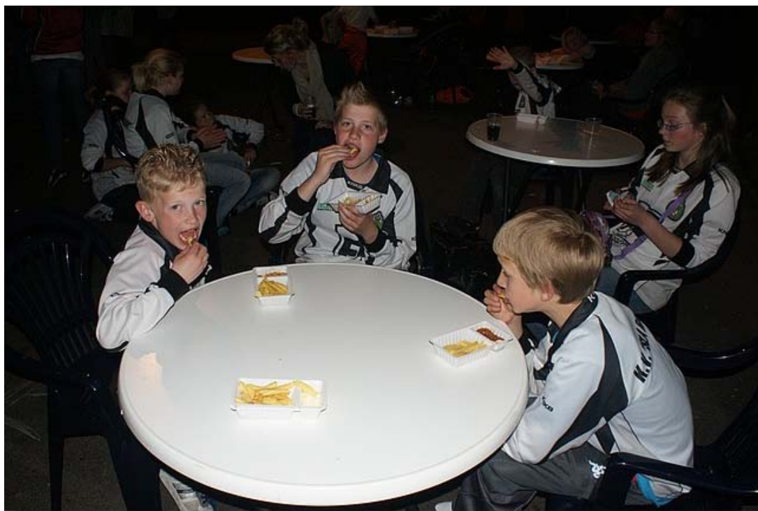
Tussendoor werden de consumptiebonnen goed besteed.