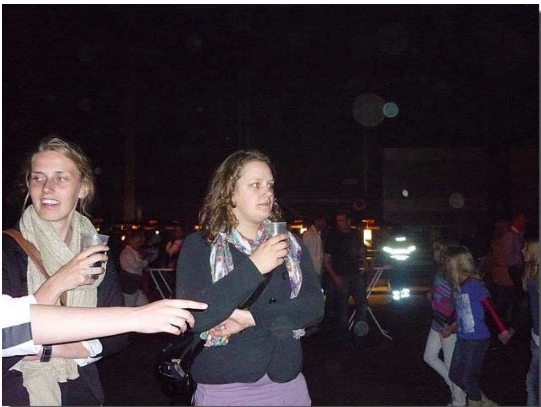
Leden van de jeugdcommissie verzorgen de begeleiding.