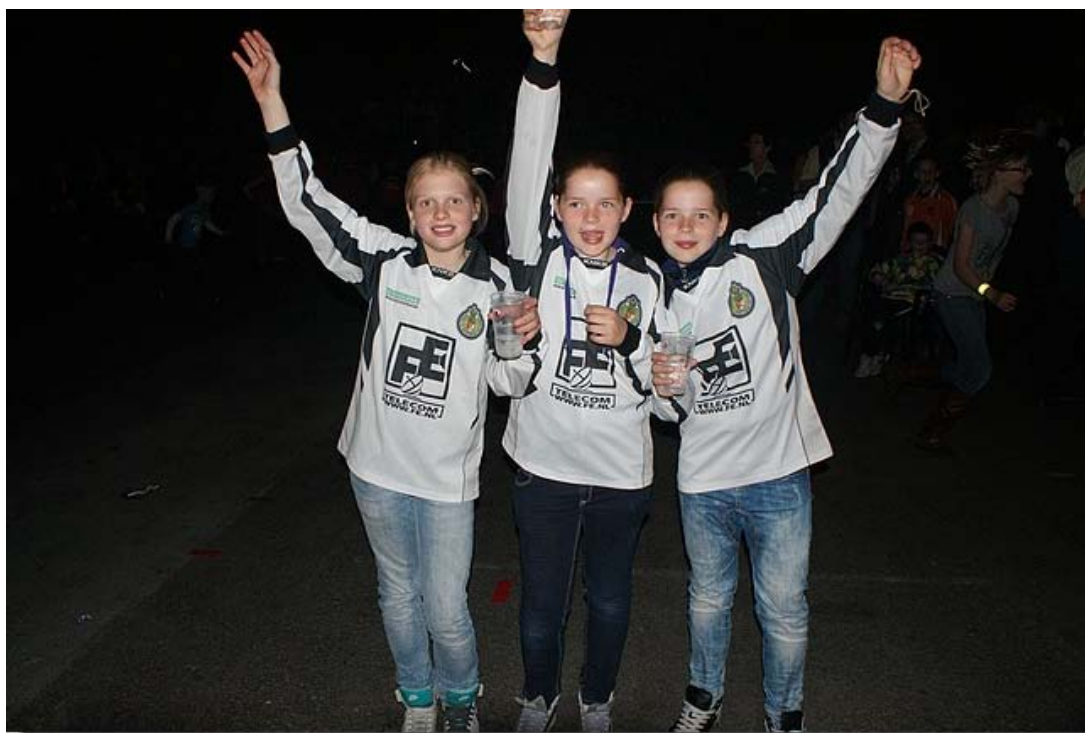
De jeugdleden vermaakten zich prima!