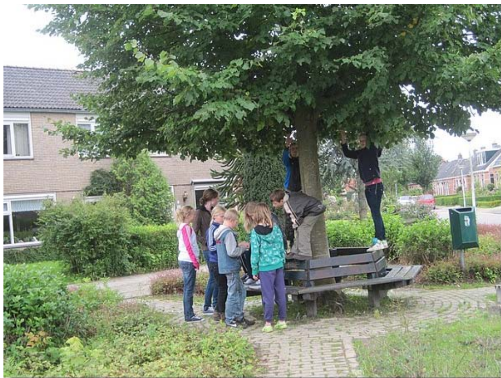
De oudere groep jongeren troffen we bij het bankje hoek gronemanstraat.

Begin pagina English page Engelum Geschiedenis Dorpsfoto's Kerkklokken Bewoners Dorpsbelang Verenigingen Jeugdclub De oude doos Woningaanbod Sponsors K.v.Sla Raak Museum Fietsroute Links Archief Redactie E-mail Gastenboek