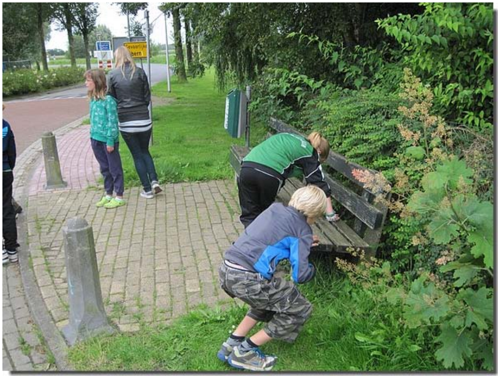
Er moest een diamant worden gezocht bij een bankje.