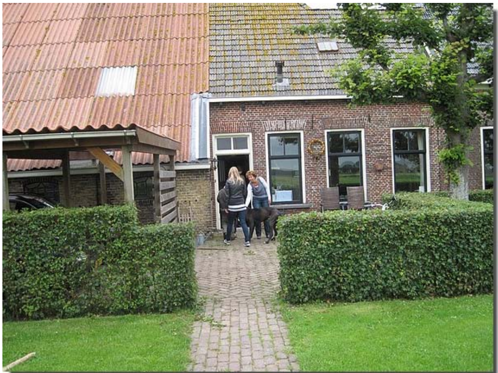
En daar werden ze vriendelijk onthaald.