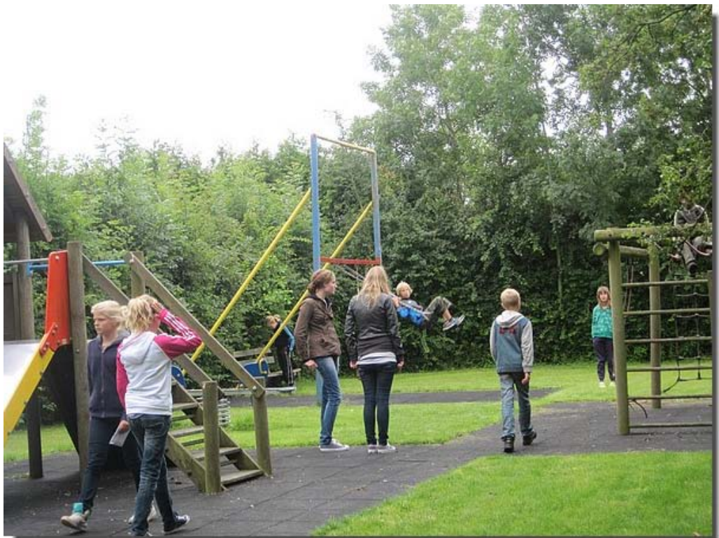
Dan nog maar even terug naar de speeltuin.