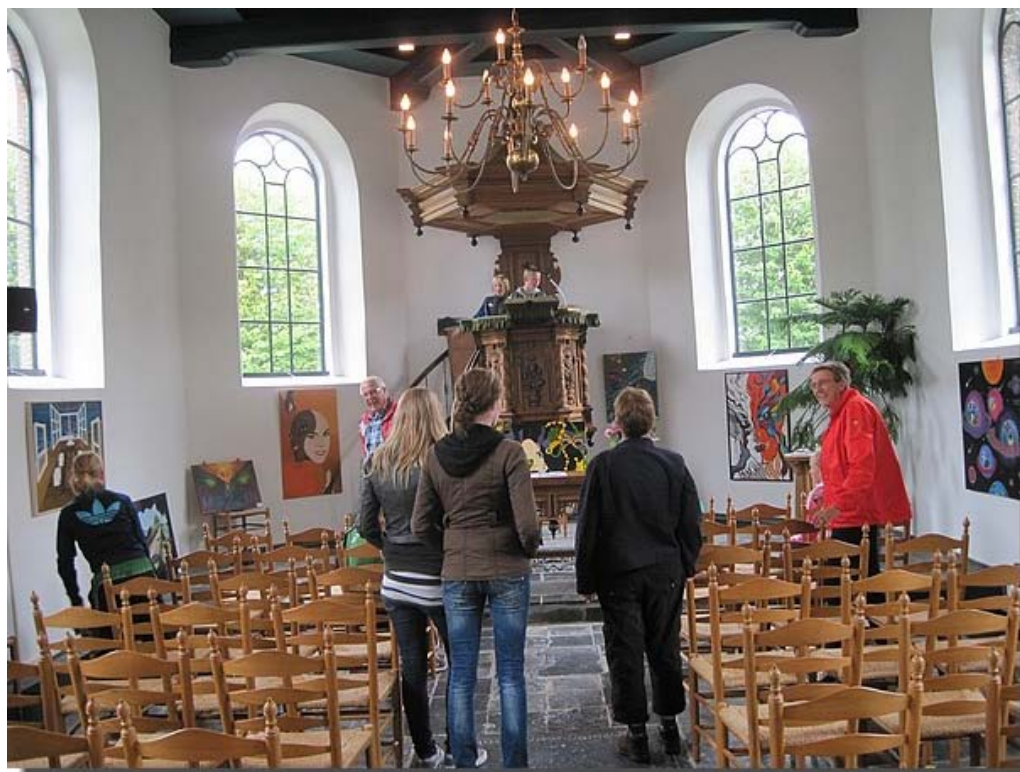
En die was toch al open op zaterdag middag.