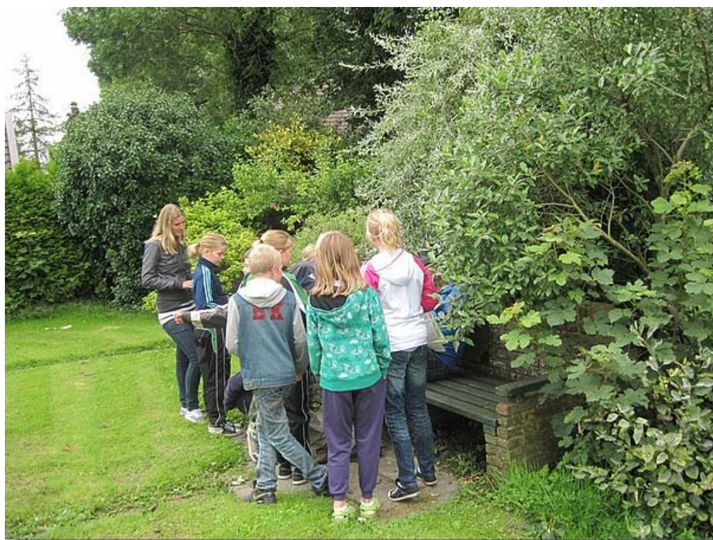
En ook deze groep vond de boef op het bankje.