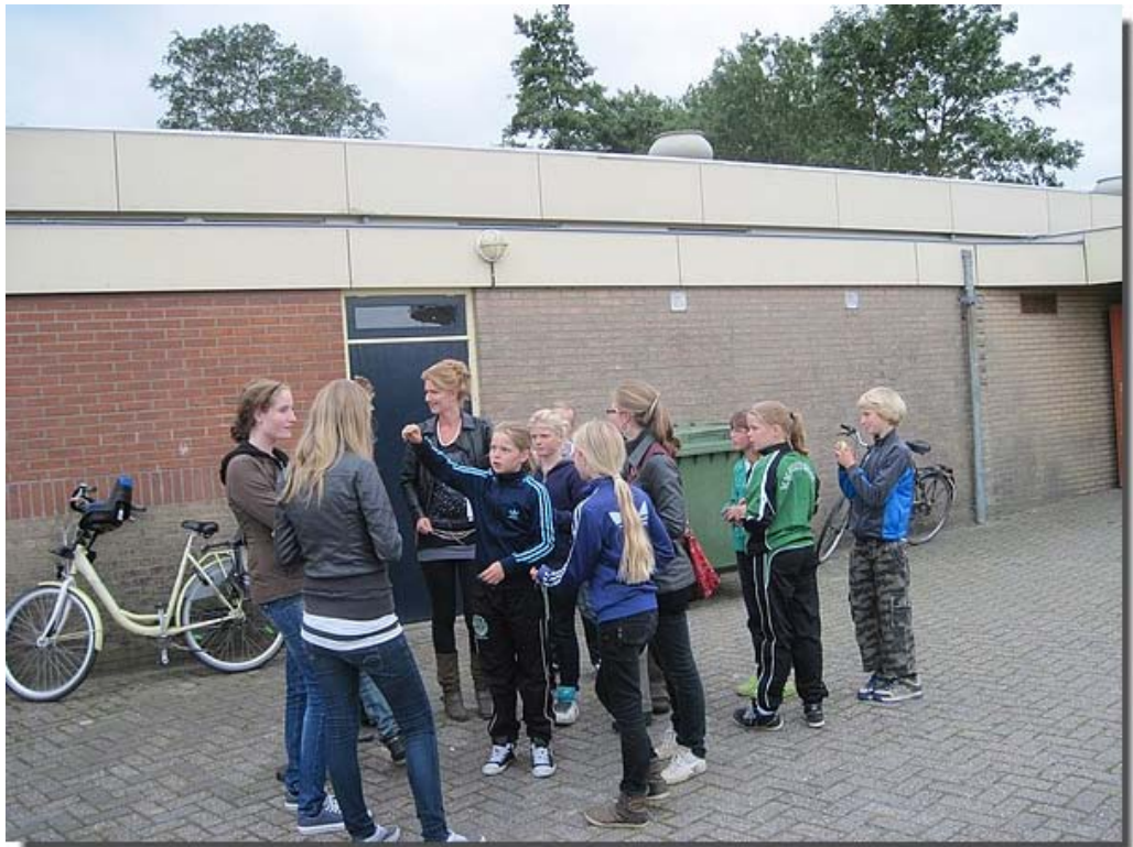
En bij het dorpshuis was de tocht ten einde.