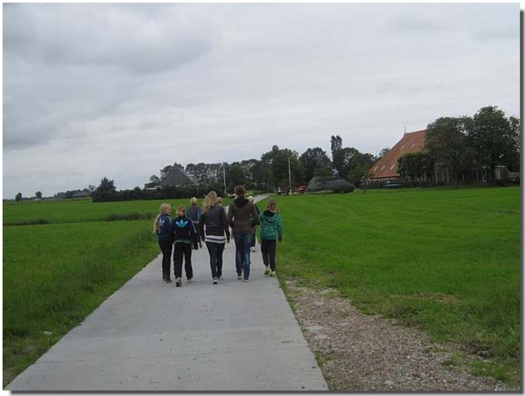
Richting de Mts. Bakker.