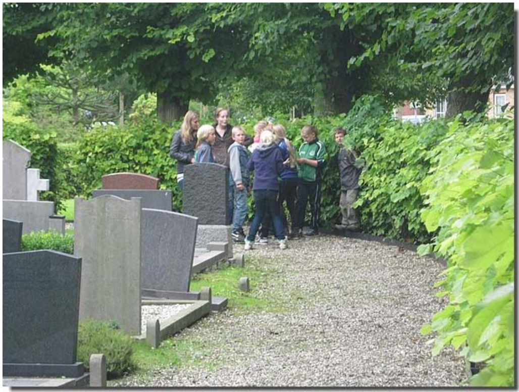
Ook hier moest nog een opdracht worden gemaakt.