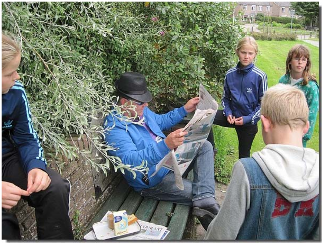
Ze misten nog een aanwijzing.