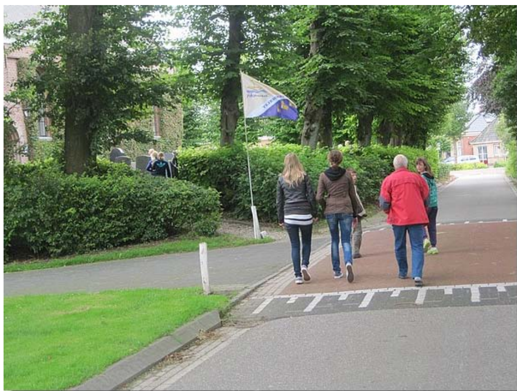
En dus kon de groep weer verder. Deze keer naar de kerk.