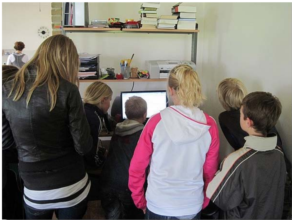
En het antwoord kwam al snel.