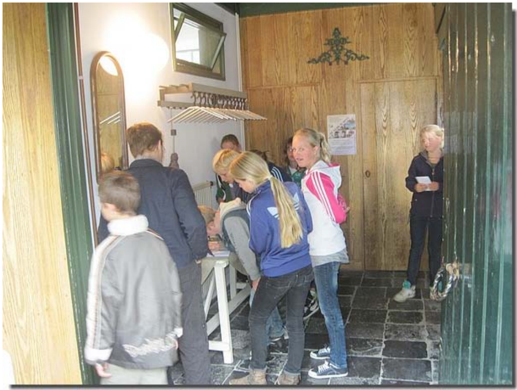
En iedereen zette zijn naam even in het bezoekers boek.