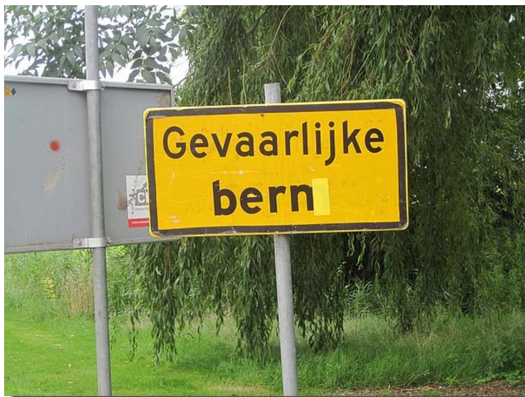
En past u op want in Engelum hebben we...