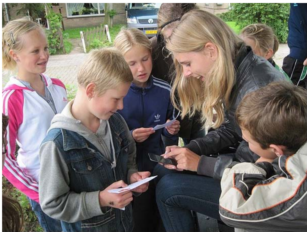
Daar werden moeilijke formules berekend en geheime codes ontcijfert.