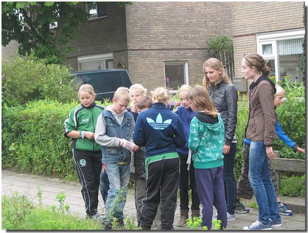
En later vonden ze bij het bankje in de Gronemanstraat de diamanten.