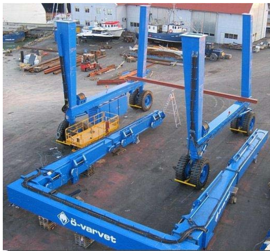
Hier staat het onderstel klaar. Dit alles opgebouwd met de oude bootlift.