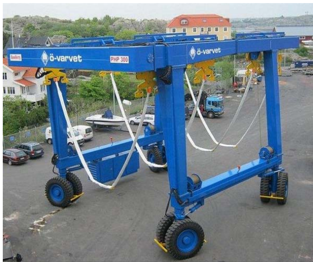
Dit is dan het eindresultaat van de nieuwe machine.