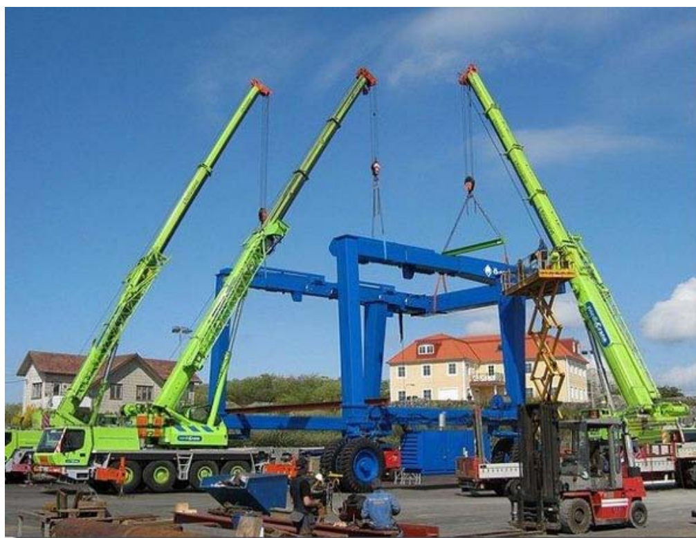
Vanaf deze fase kan er niet verder gewerkt worden zonder hulp van drie telescoopkranen.