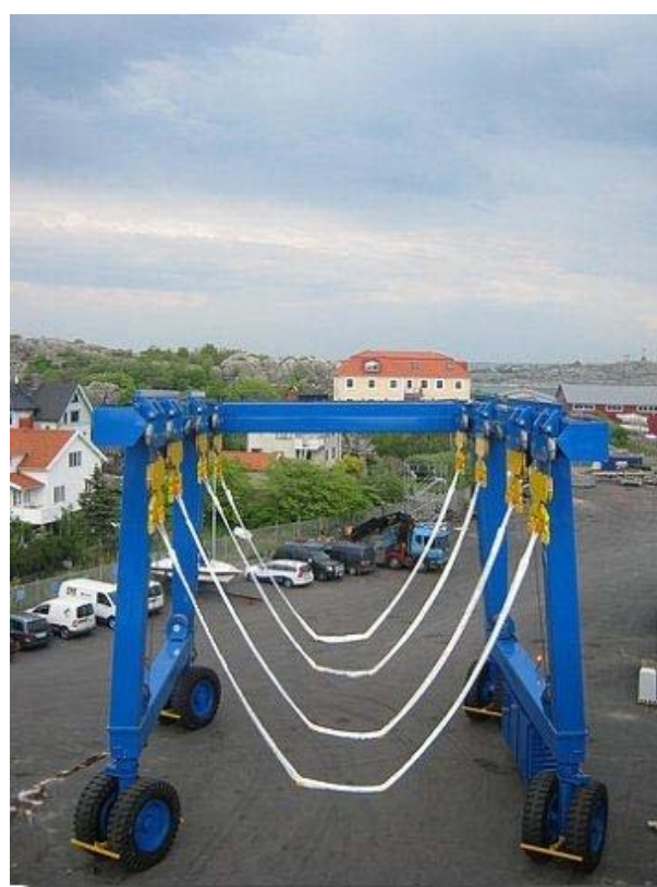
Hier staat 160 ton aan bootlift.