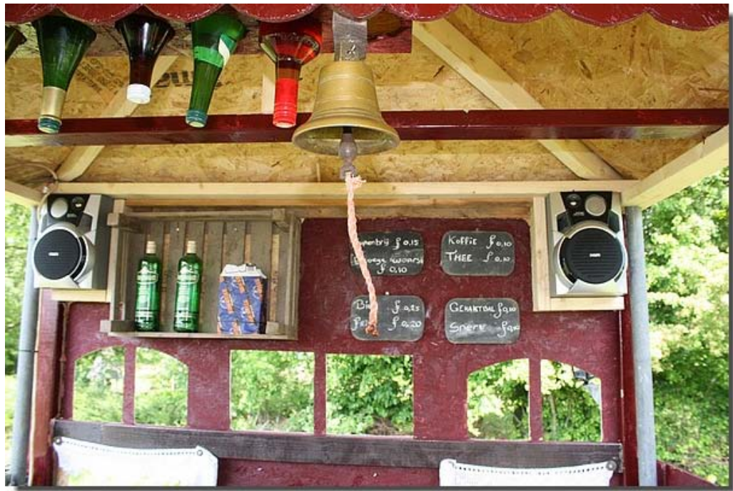
De reporter maakte nog enkele detail foto's...