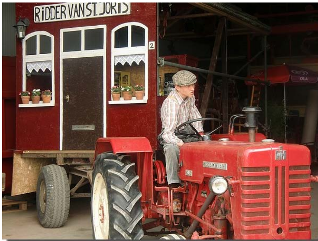
Op naar de optocht !