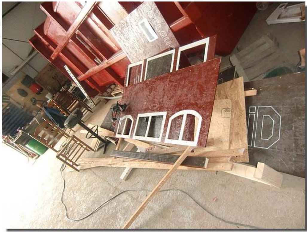
Helaas moet de wagen ook weer afgebroken worden...