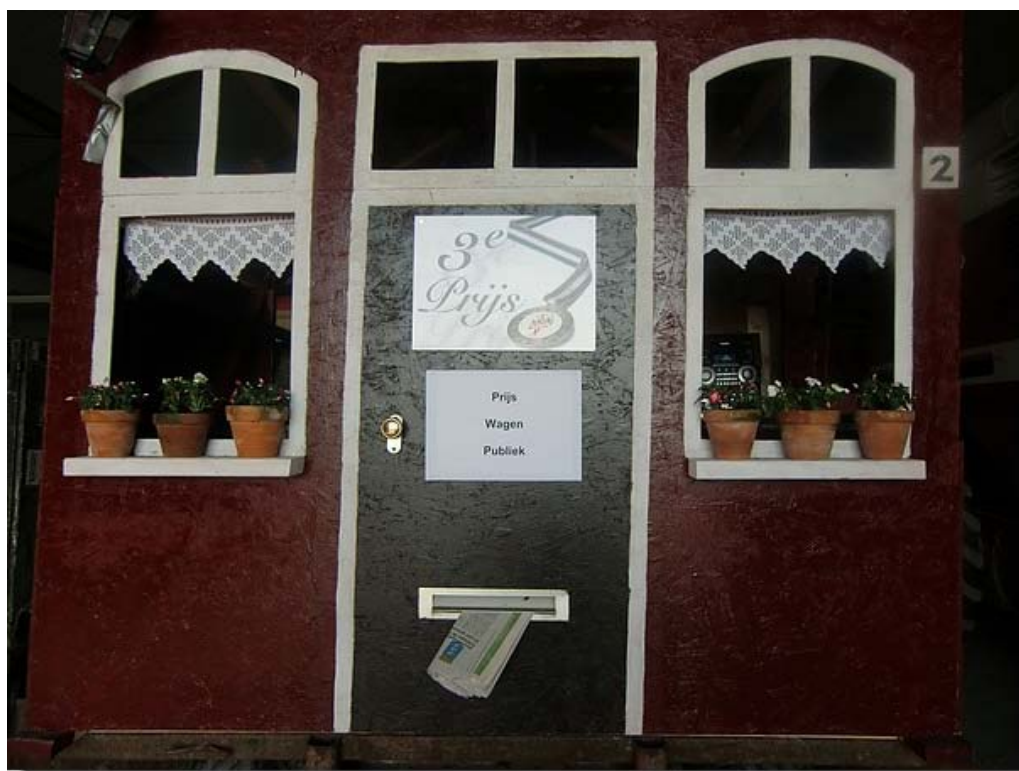
Vrijdagavond was de prijsuitreiking en werd bekend gemaakt dat De Ridder van Sint Joris de 3e en publieksprijs had gewonnen !!