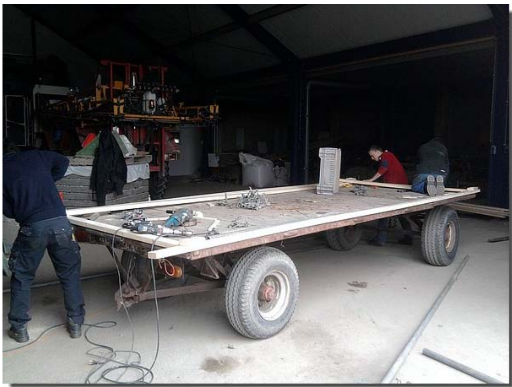
Een goed begin is het halve werk!