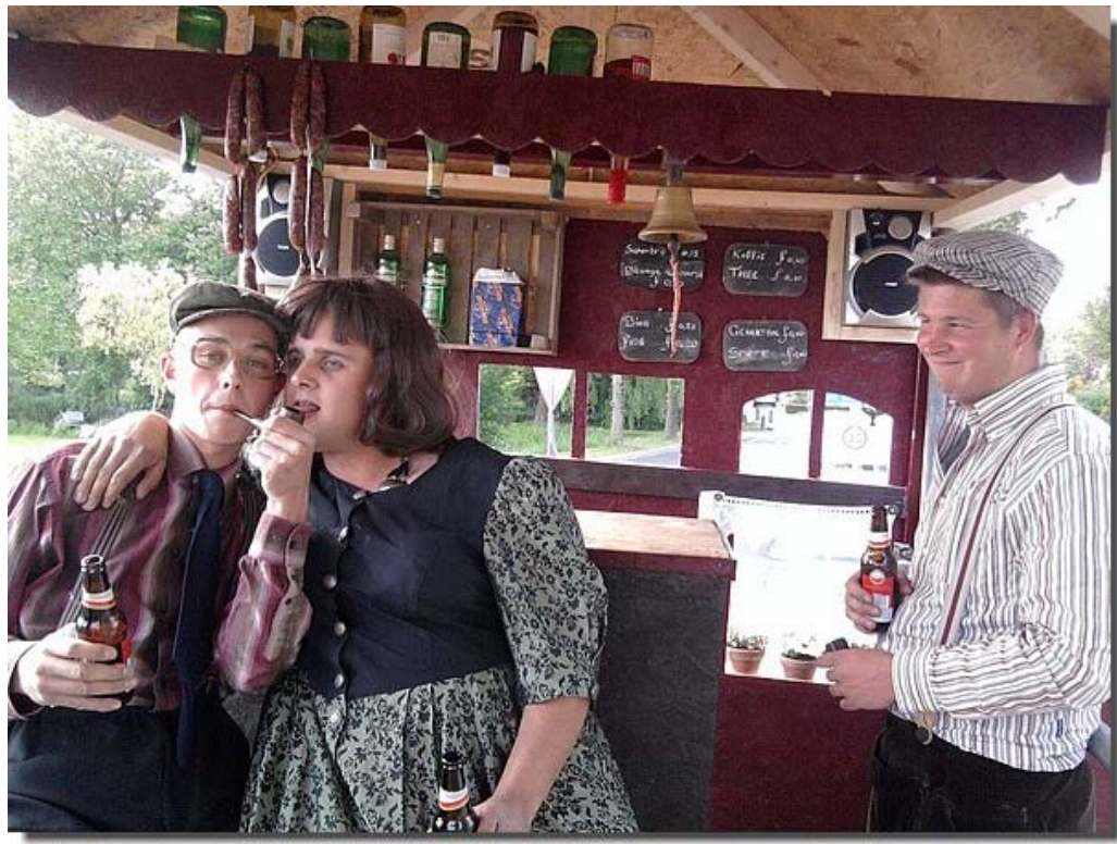
De pijp wordt geproefd...