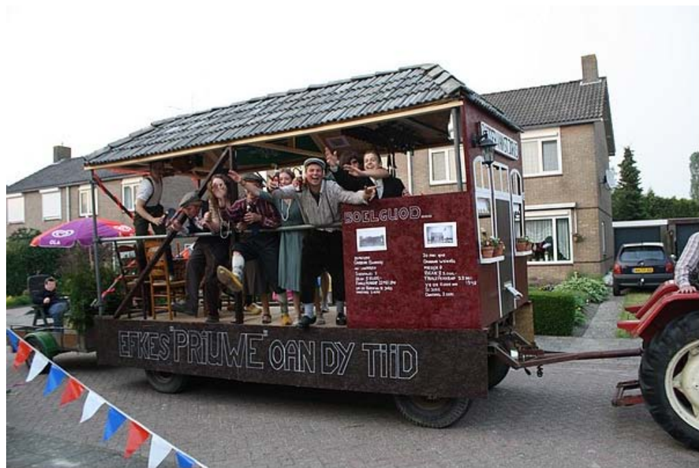
Met een biertje en oude muziek, werd deze dag wel heel uniek !