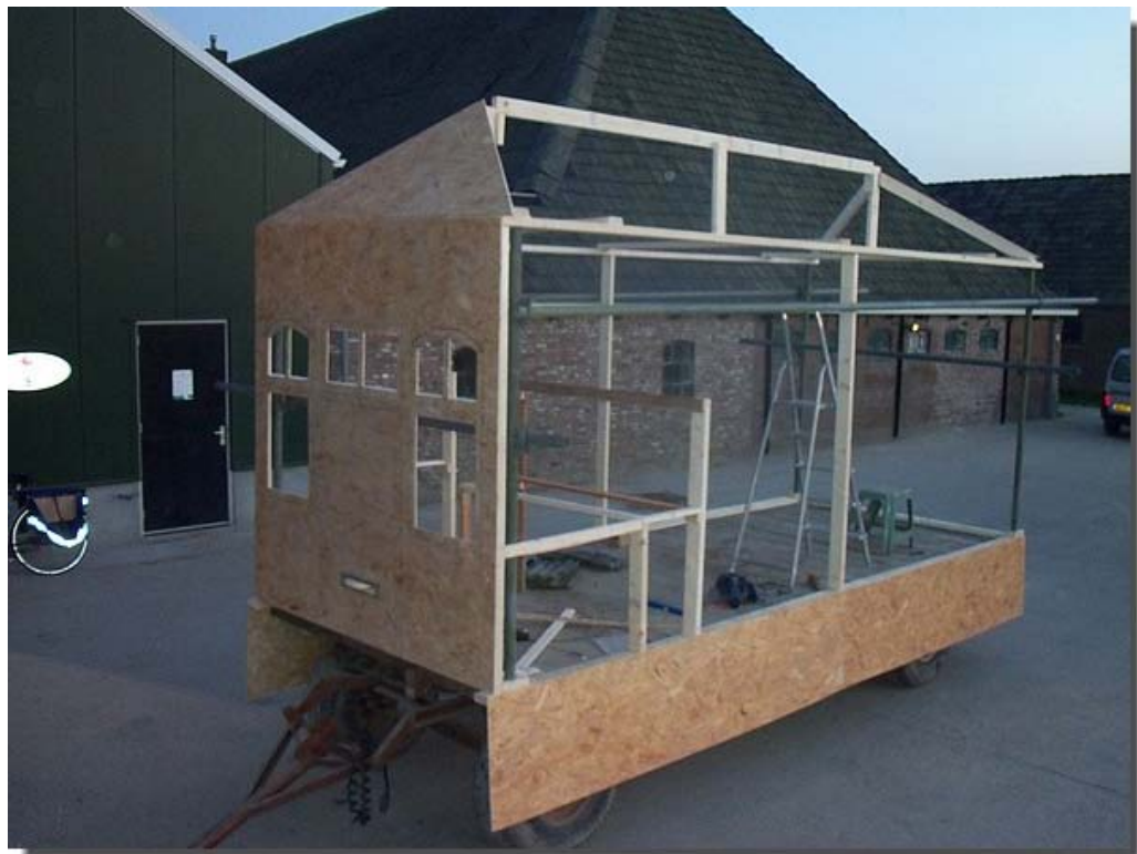
Het begint er al op te lijken !