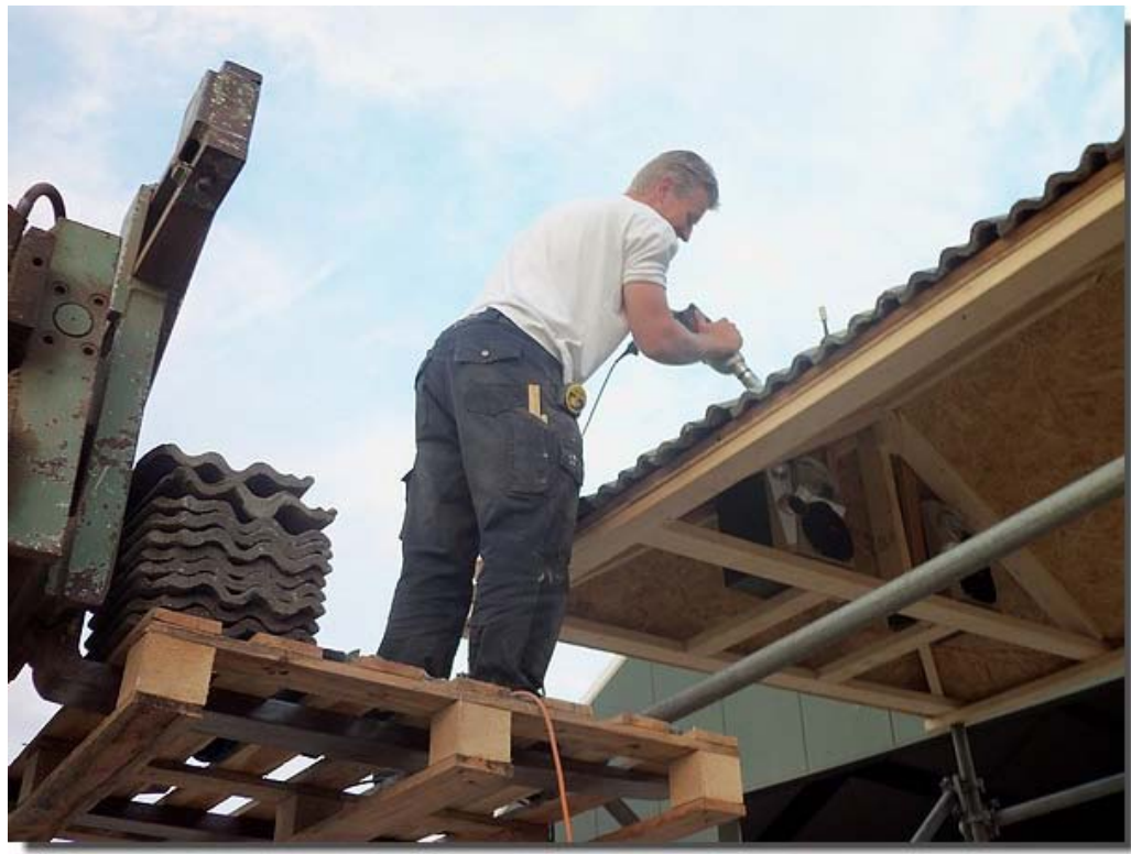
Alles wordt goed vast gezet !