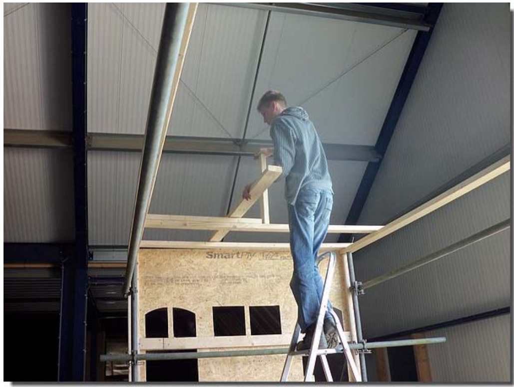
Ook moet er een dak op komen.