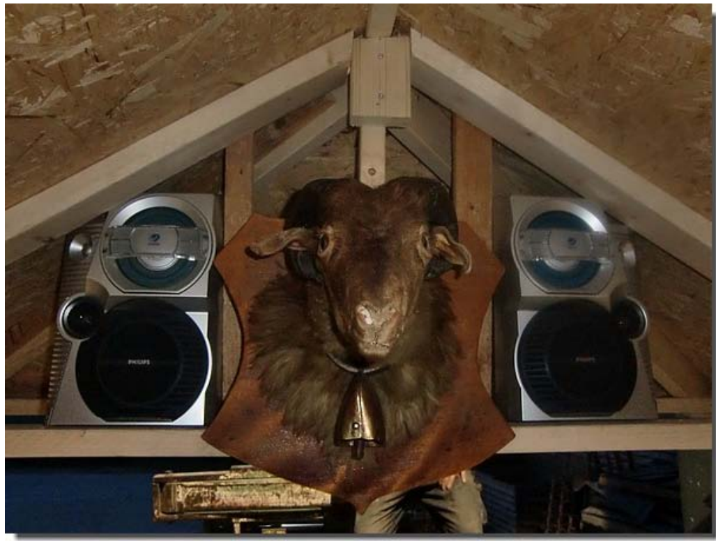
De geitenkop van Rinze krijgt ook een mooi plekje !