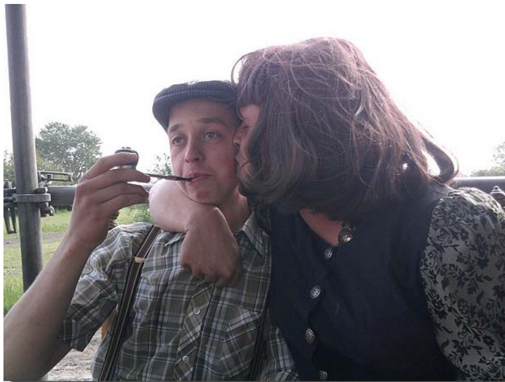
Na een paar biertjes ontstaan innige vriendschappen...