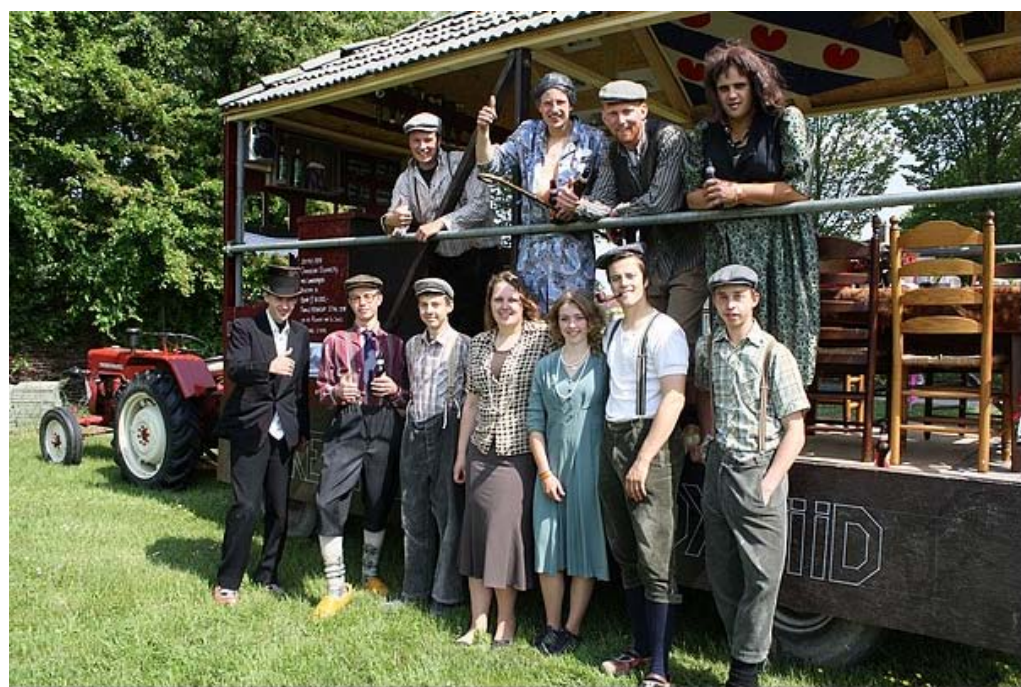
Dan allemaal nog even op foto..