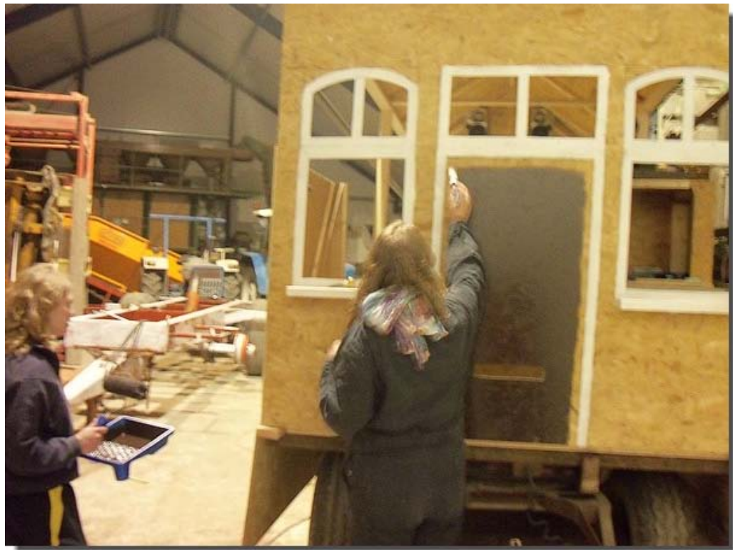
Terwijl er aan de voorkant druk wordt geschilderd...