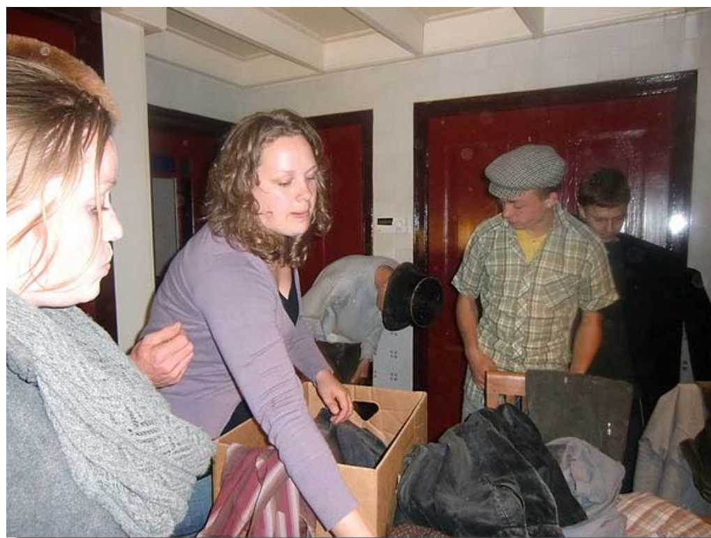
Om helemaal in de stijl van vroeger te komen werden er bijpassende kleren gezocht.