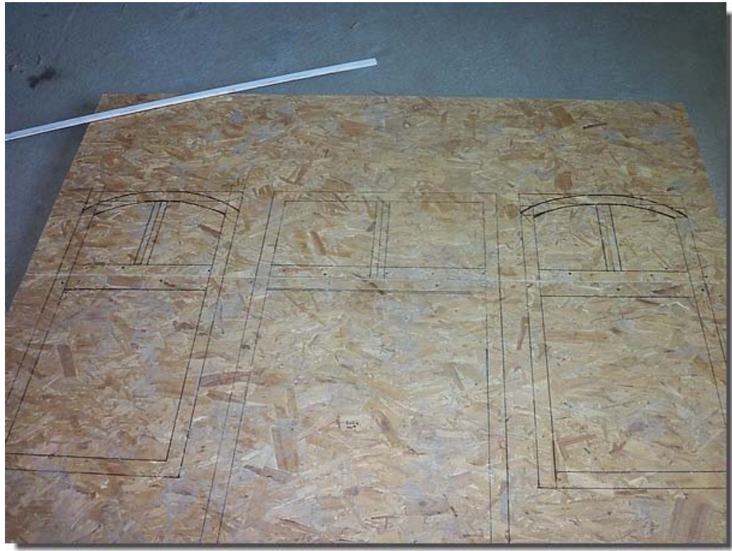
Zo moet het ongeveer worden...