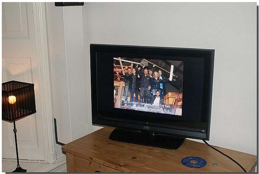
Na afloop werden alle foto's nog eens bekeken...