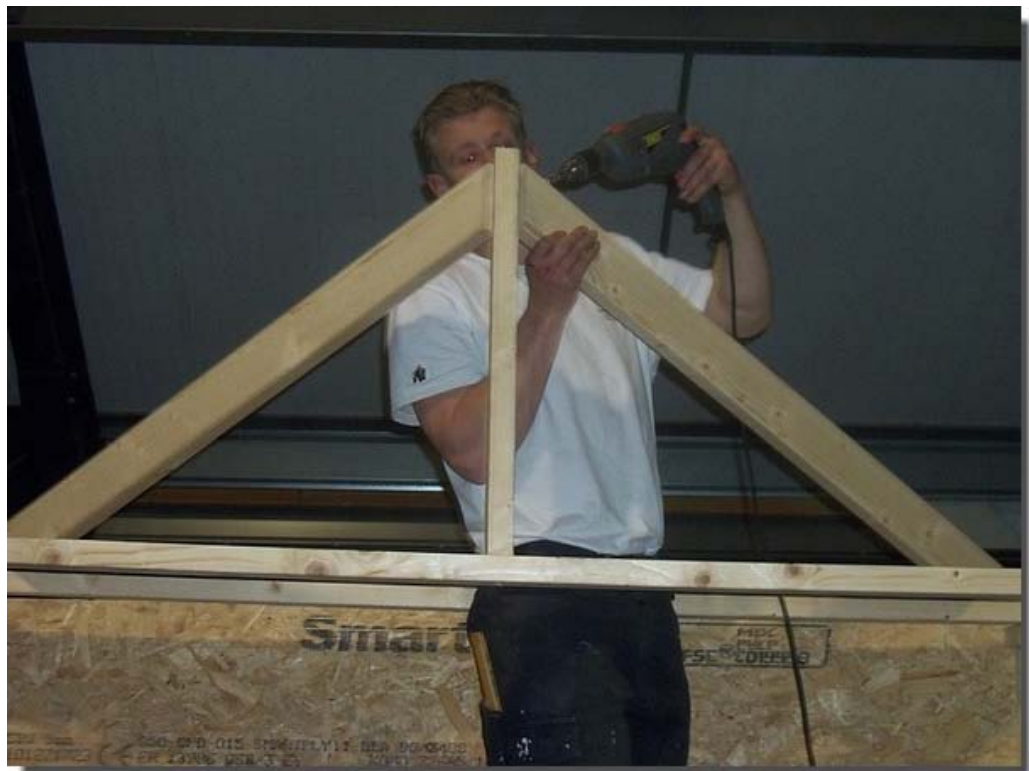
Bel de vakman, daar heb je gemak van !!