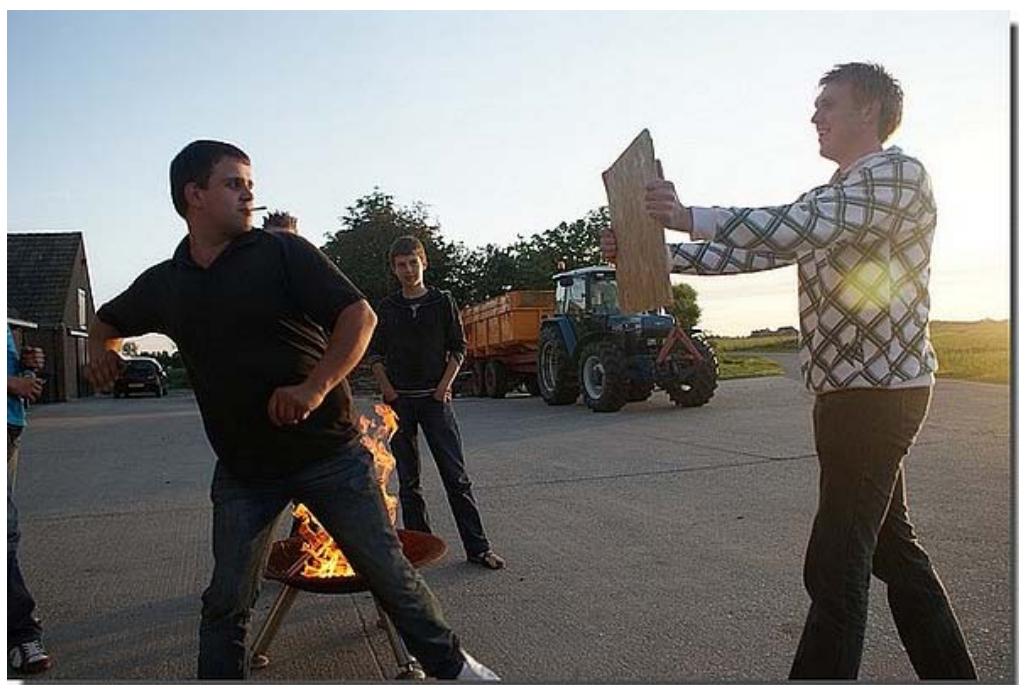
Tussendoor was er tijd voor dulle pret !