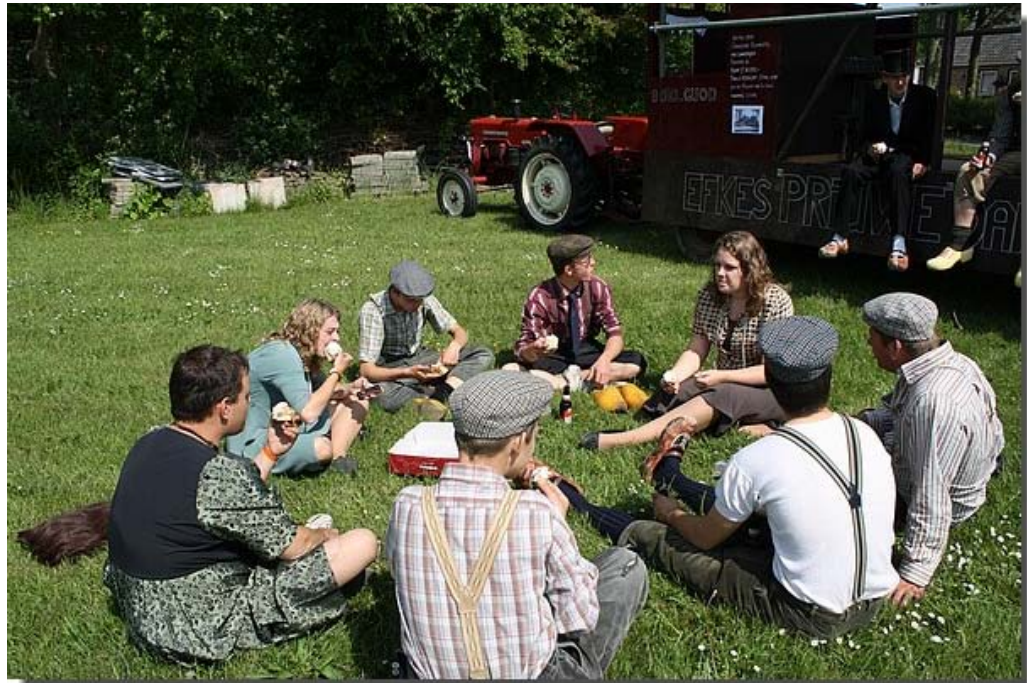
En genieten van de gewonnen prijs !