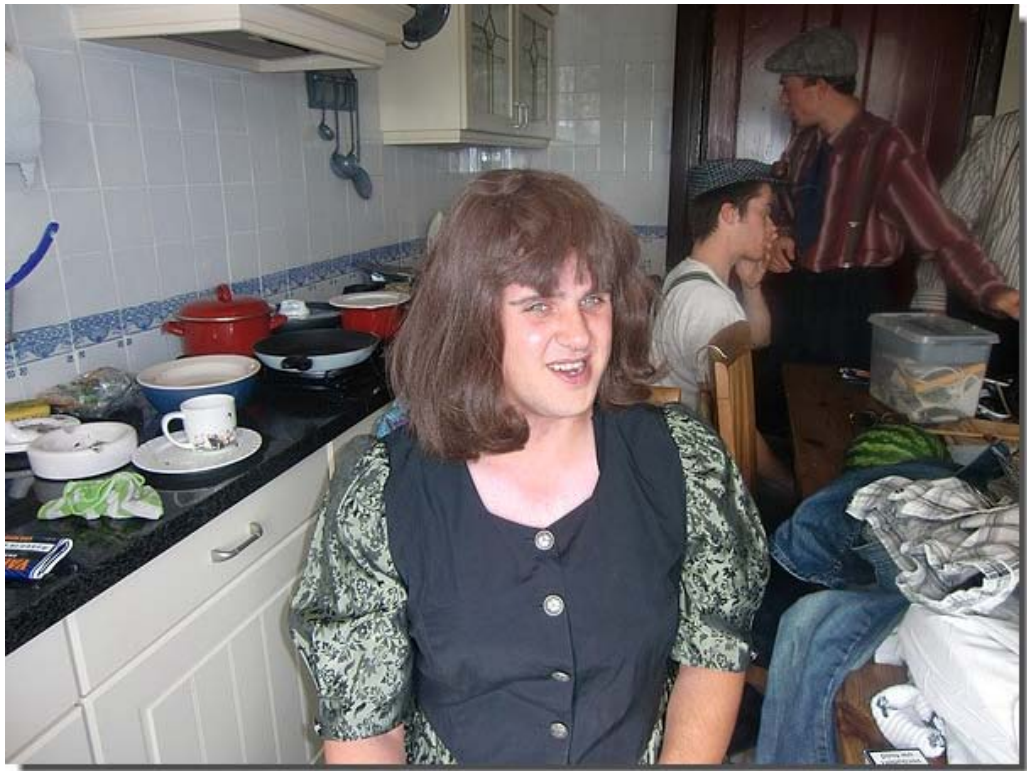
En wie is toch deze aantrekkelijke vrouw?