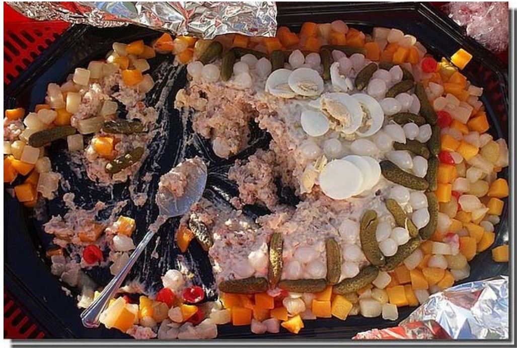
Dat was smullen !