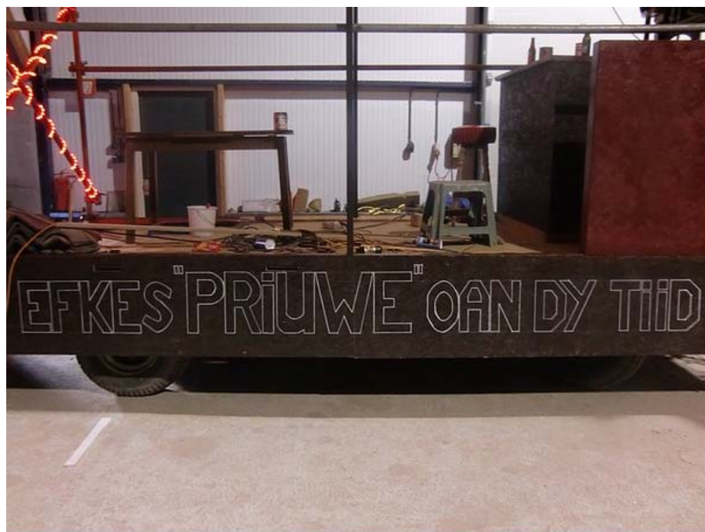
De slogan van de groep.