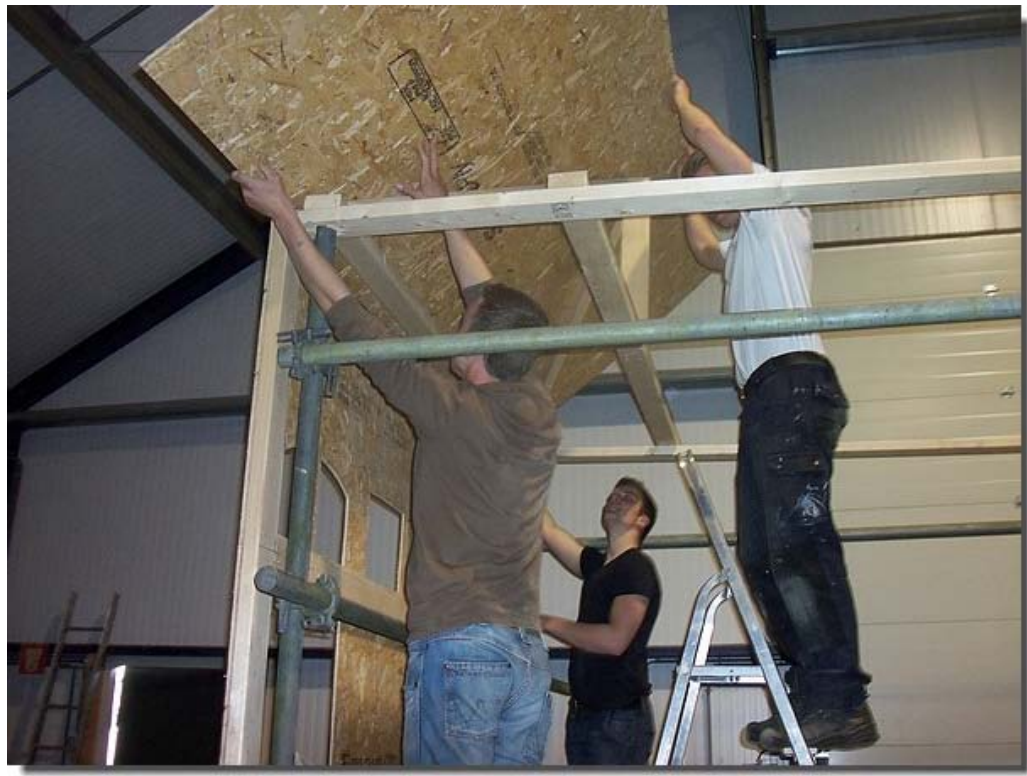
Dus dat wordt passen en meten...