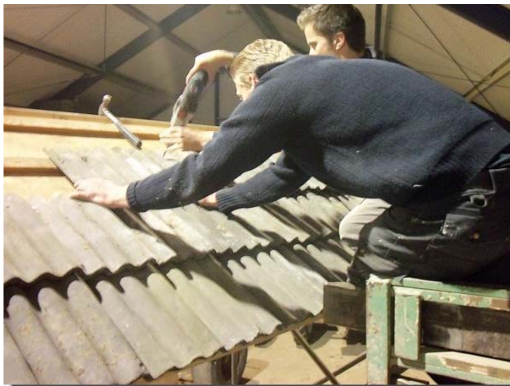
Op een dak horen ook dakpannen...