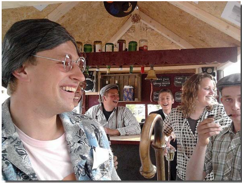
De stemming kwam er al aardig in !