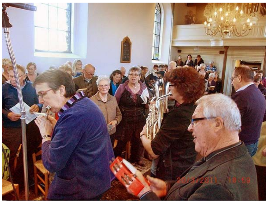
Het publiek zingt dan ook volop mee met het maitiidsliet.