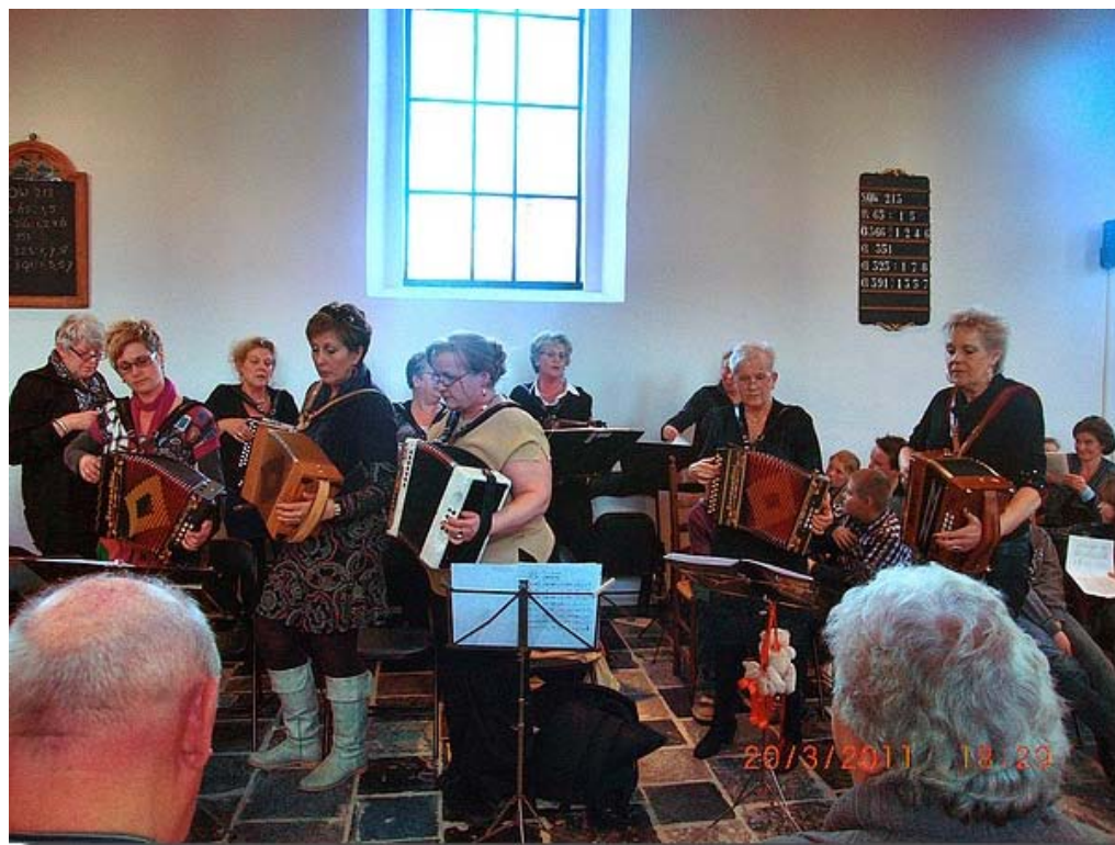
Ook de Swingende Balgen wisten de stemming er goed in te brengen. Deze dames op de accordeon stonden te swingen in de kerk en het publiek kon lekker mee zingen.