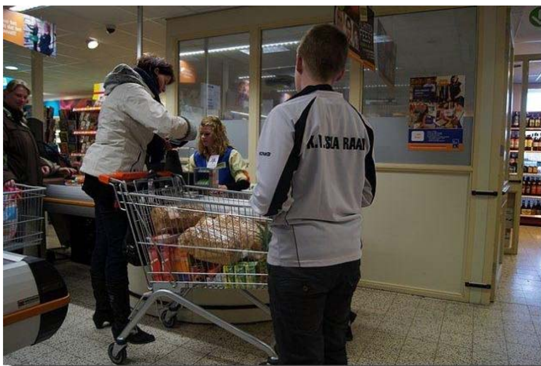
Bij een goed gevulde kar moet je zijn.