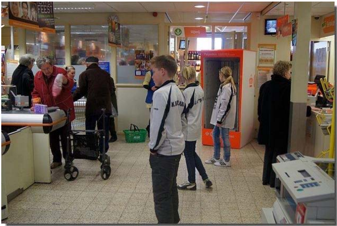
Achter de kassas vragen de leden van de kaatsvereniging om de muntjes in onze buis te doen.