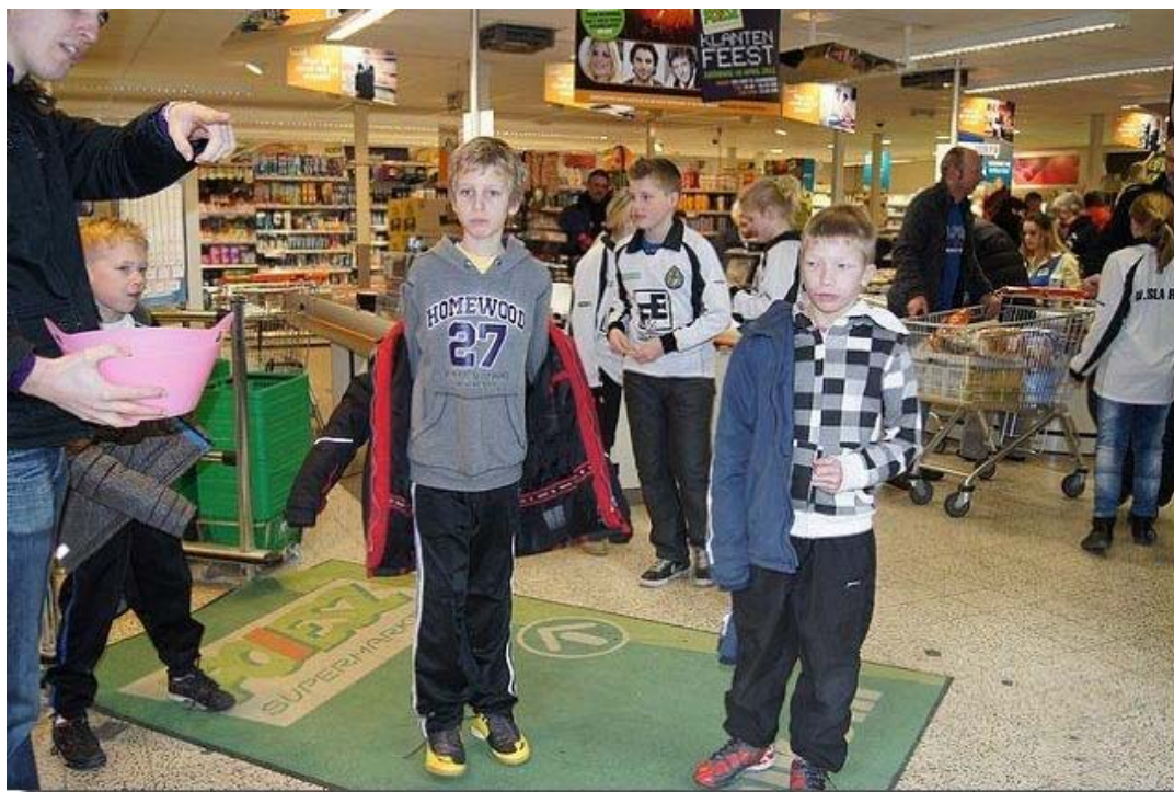
Wisseling van de wacht. snel even omkleden.