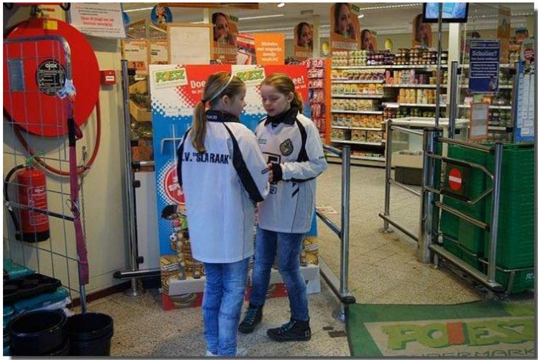
Bij binnenkomst word al een spekje aangeboden.