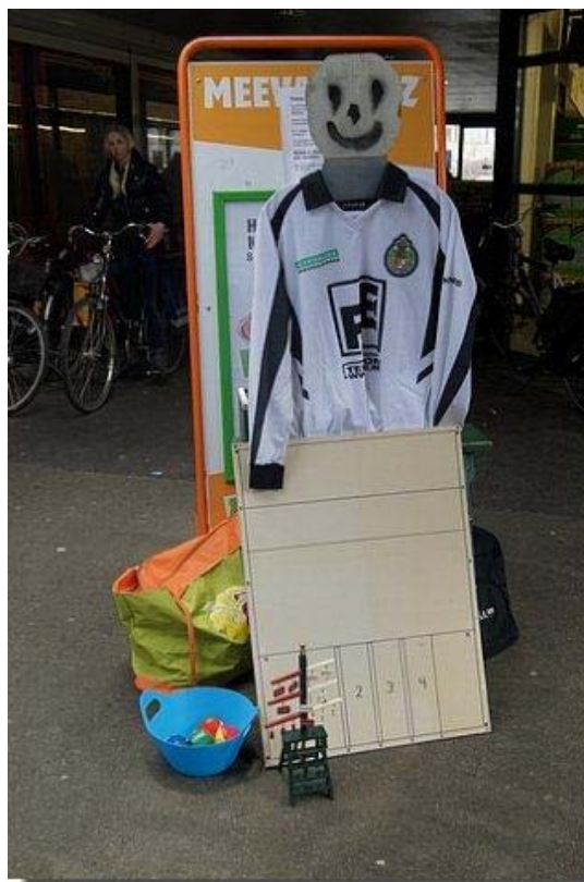
Hier kan men een balletje slaan en uitleg krijgen omtrent het kaartspel.