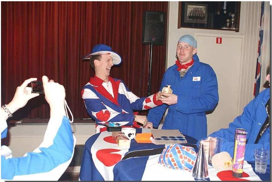
Het team met de witte petten moest genoeg nemen met zilver en het team met de blauwe petten ging er met het goud vandoor!!