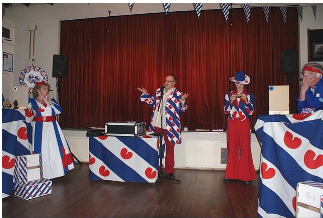
Er werd 4 tegen 4 gespeeld met natuurlijk de nodige hulp van de "tribune".