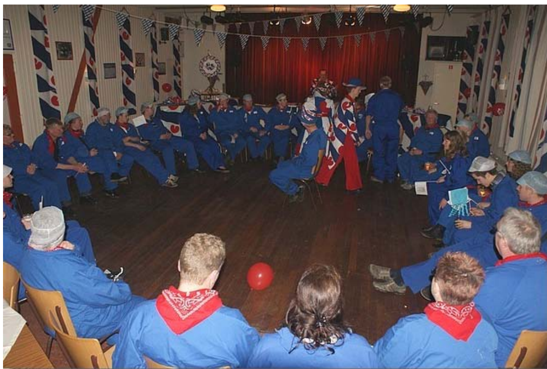
En vervolgens weer verder met de quiz.