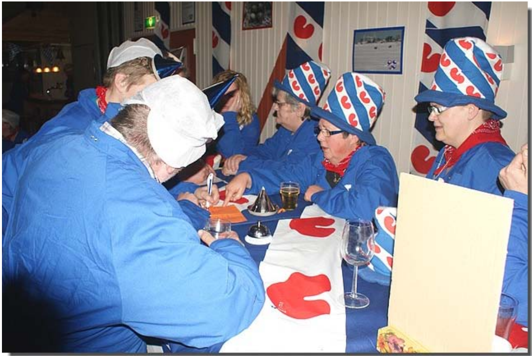
Koortsachtig overleg tussen beide teams waarbij soms wel eens werd vergeten dat het maar een spelletje was.....