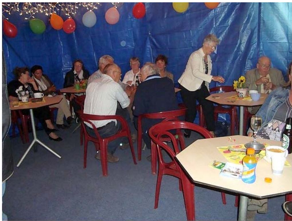
Binnen in de schuur was het prachtig aangekleed en versierd.

Begin pagina English page Engelum Geschiedenis Dorpsfoto's Kerkklokken Bewoners Dorpsbelang Verenigingen Jeugdclub De oude doos Woningaanbod Sponsors K.v.Sla Raak Museum Fietsroute Links Archief Redactie E-mail Gastenboek