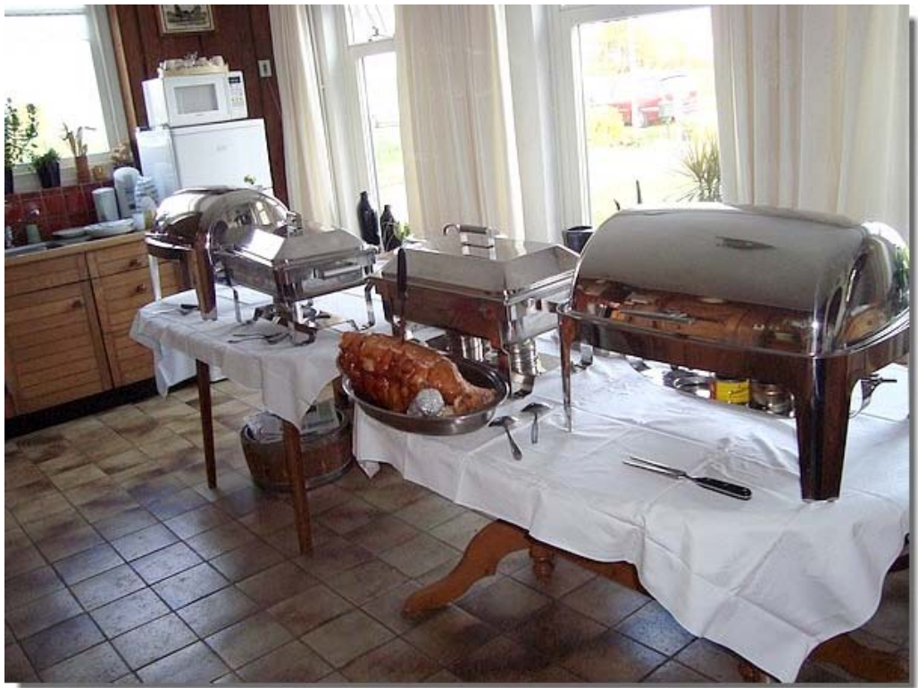
En de inwendige mens werd natuurlijk niet vergeten.