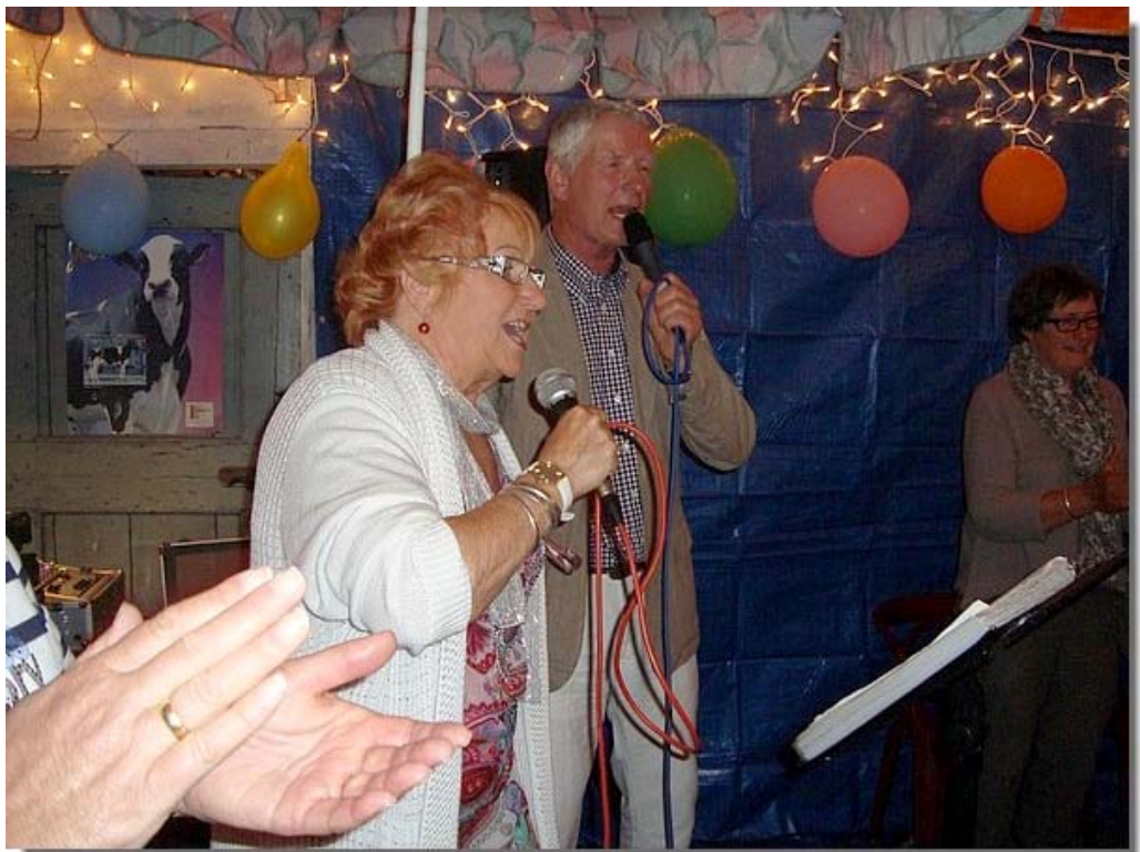
Er was live muziek.