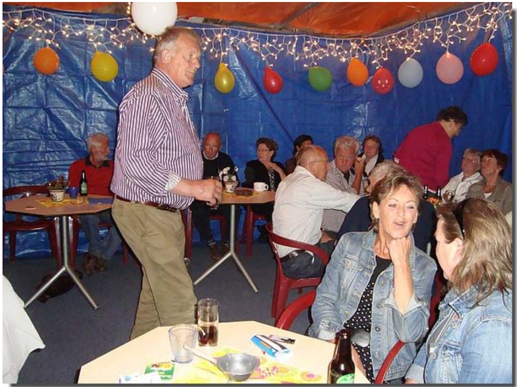
En de gasten vermaakten zich prima.