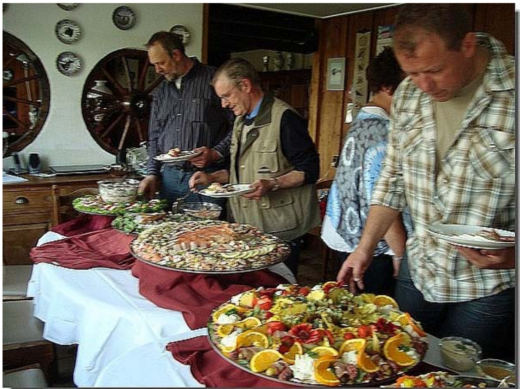
Kijk; dat is het betere werk!