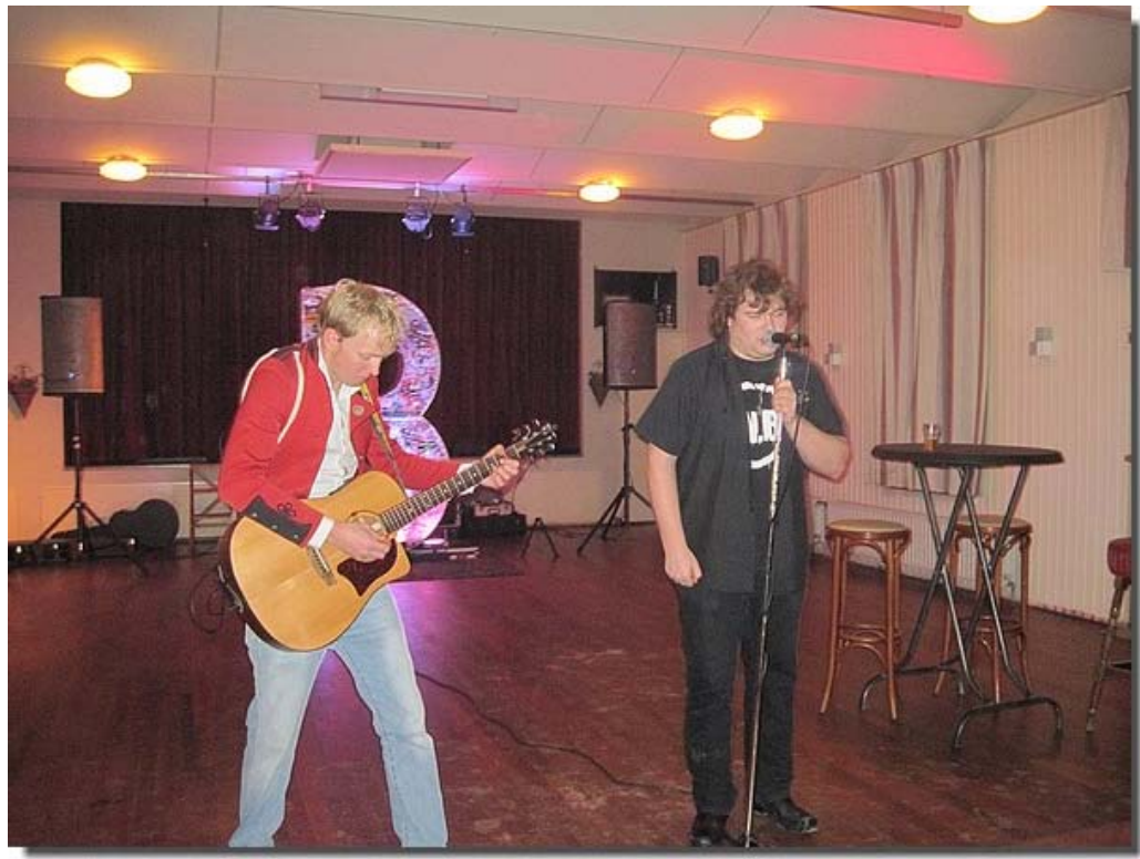
Een ware Jam-sessie ,en dat in ons kleine dorpje Engelum!