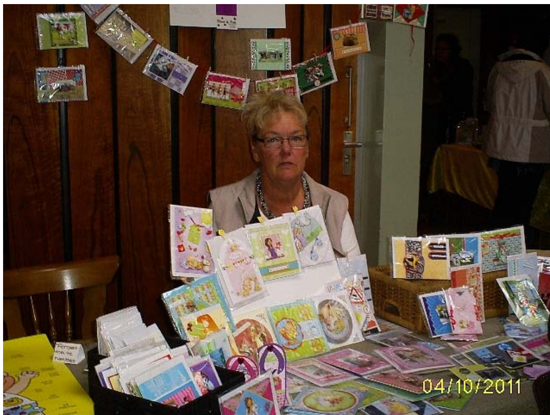
Zelfgemaakte kaarten blijven altijd in trek. hier zijn verschillende technieken toegepast, wat een grote variatie in de collectie brengt.