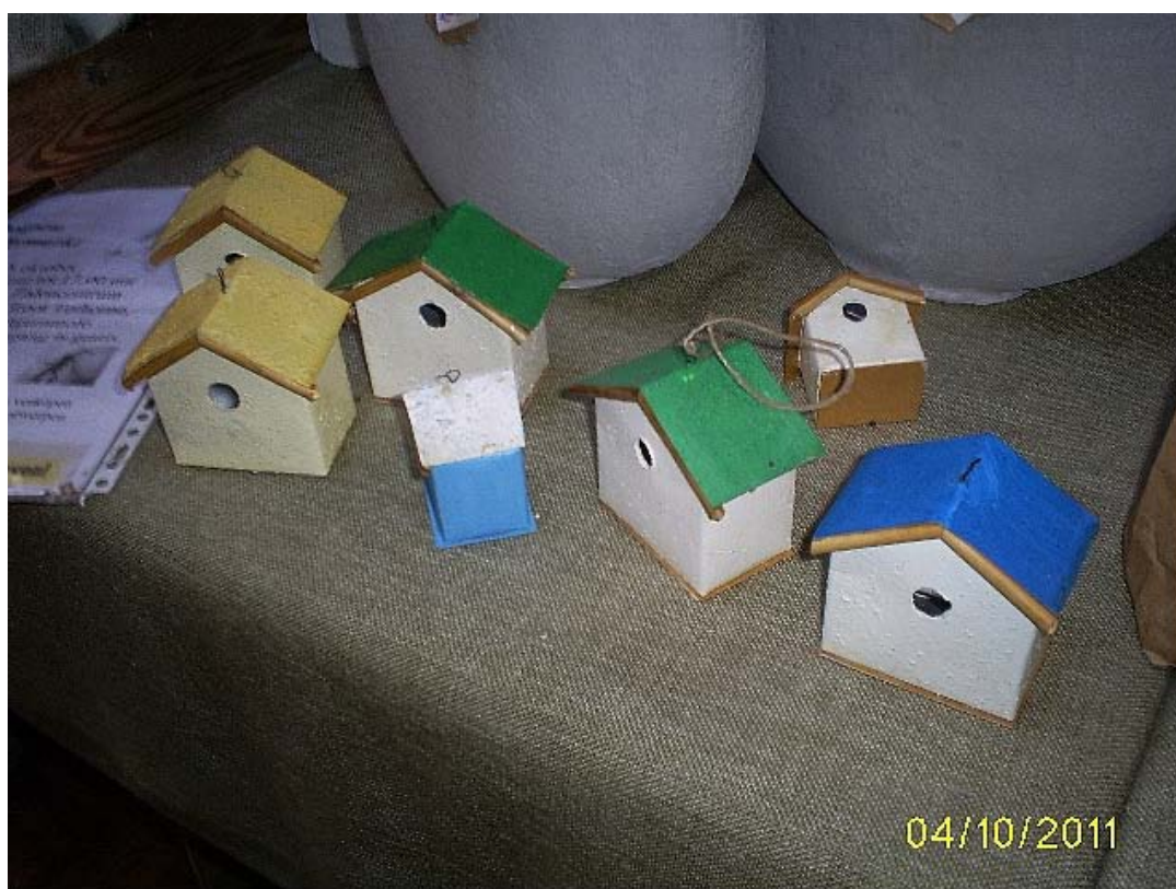
Zo zijn deze fraaie vogelhuisjes, gemaakt van koffiemelk pakjes. Verder waren er mooie cadeau verpakkingen gemaakt van o.a.kranten, in elkaar genaaid tot cadeauzakje en gevuld met allerlei lekkers voor de vogeltjes.