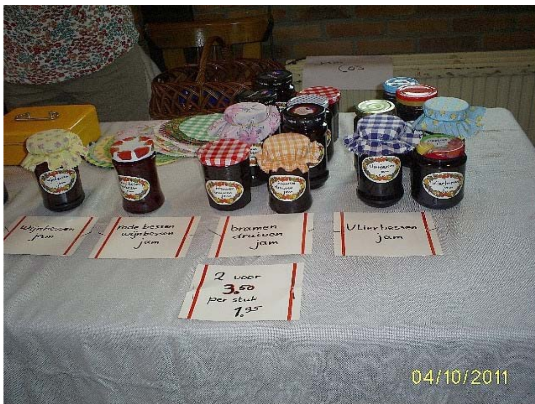
eigengemaakte jam in allerlei smaken