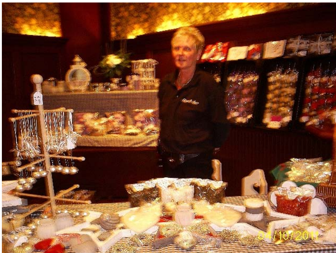
Al eerder brachten wij u een reportage over de cadeauwinkel ' Fleur en Fun ' uit Beetgum. Met nieuwe cadeaus en presentjes was ook deze ondernemster aanwezig.