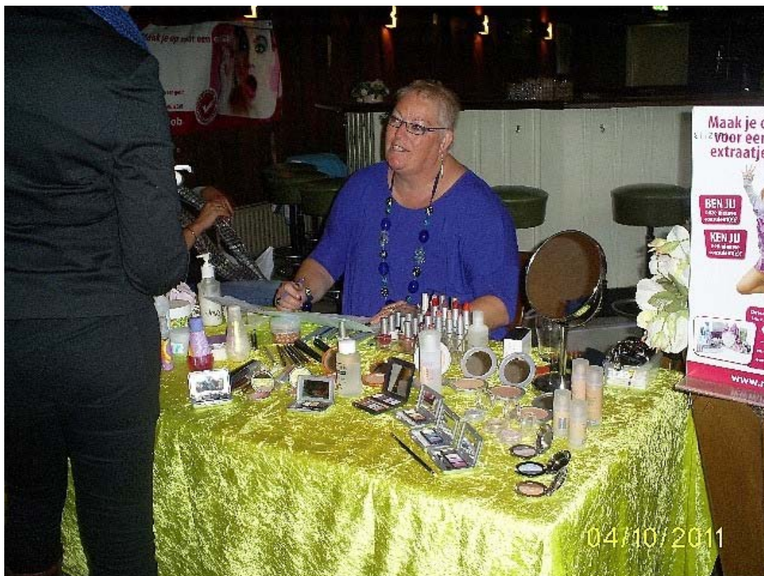
Meer schoonheidsproducten. Hier een stand van het verzorgingsproduct: Mylene