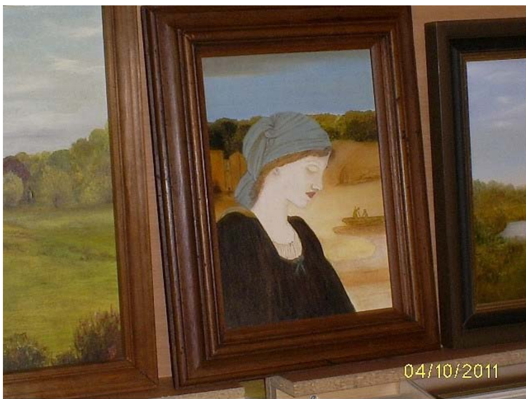
Voor elk wat wils, zo ook sfeervolle schilderijen