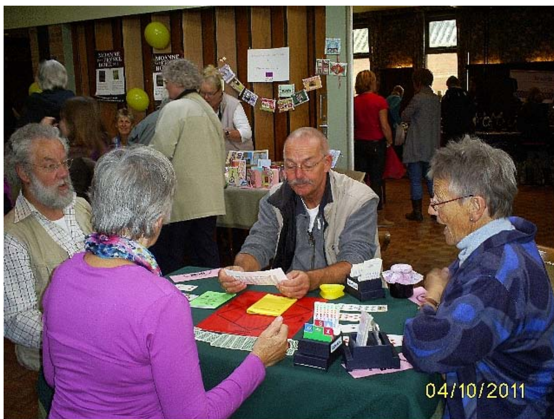
De bridgeclub onder het genot van een lekker kopje koffie, legden gezellig een kaartje. En ja hoor, ook hier is Engelum vertegenwoordigd.