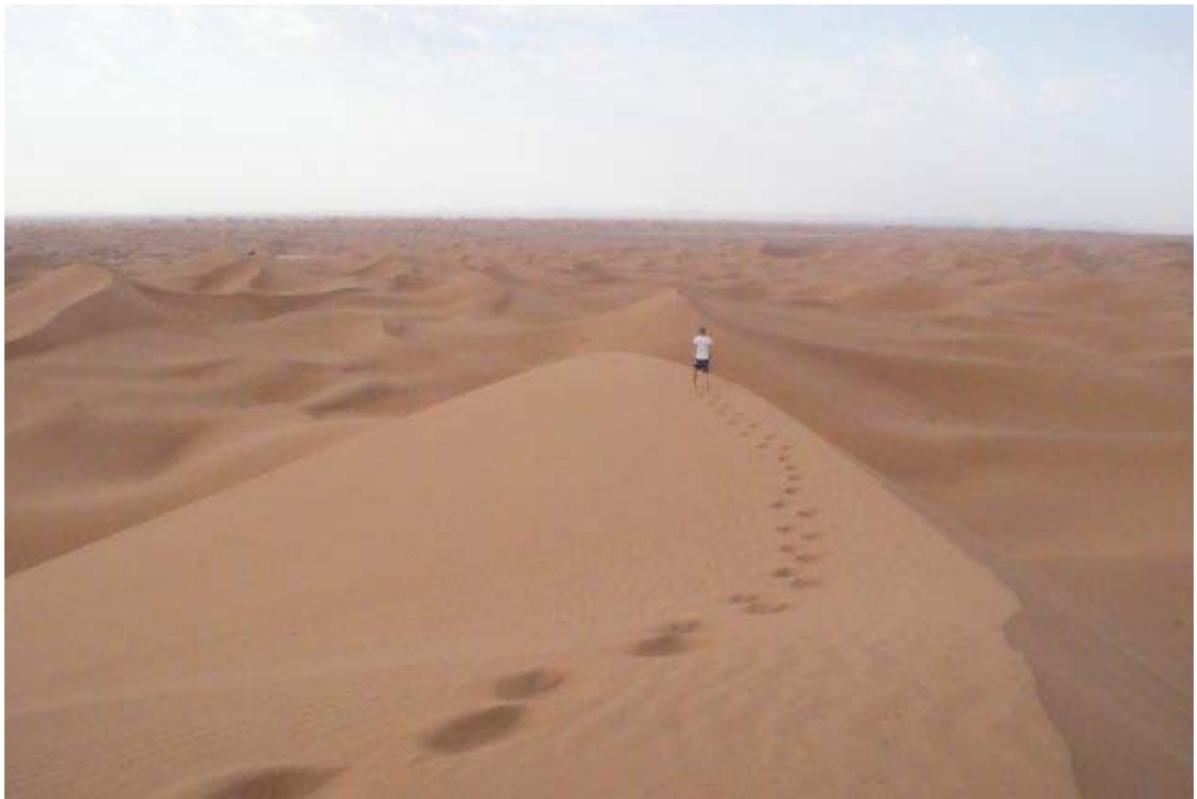
Zandwoestijn in zuid Marokko, in de buurt van Mhamid.