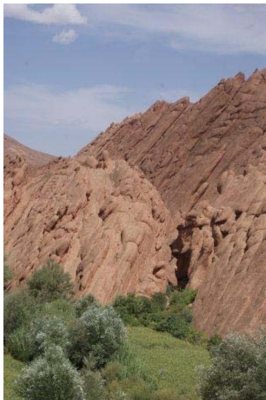
Vallei van de dadels, met bijzondere rotsformaties.