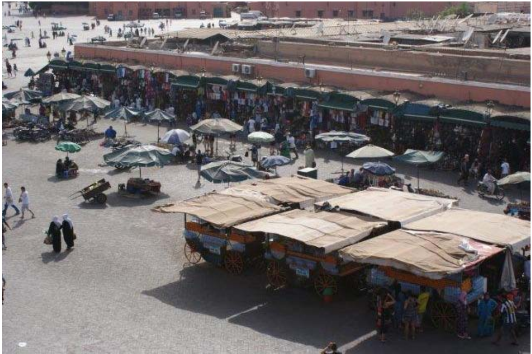
Het beroemde Djemaa el fna plein in Marrakech, met z'n vele straatartiesten, slangenbezweerder en tientallen eetkraampjes.