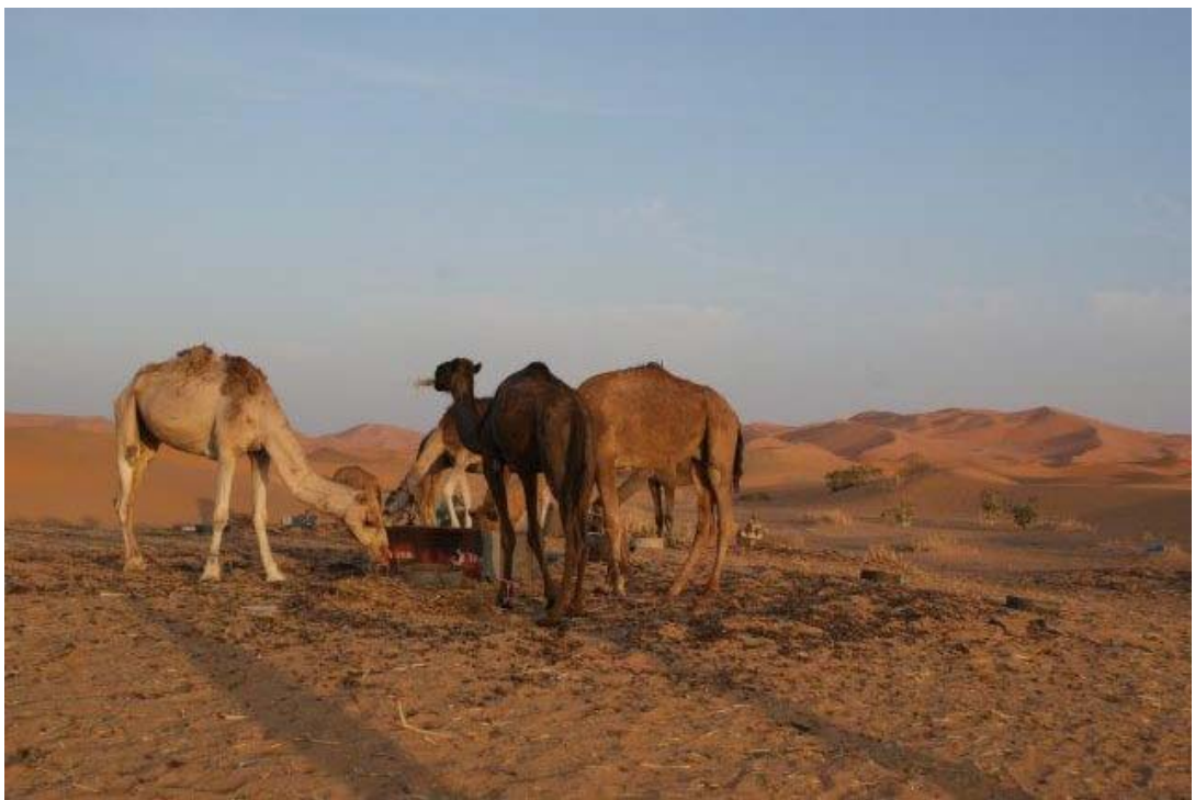
De Erg-Chebbi woestijn in zuidoost Marokko, tegen de Algerijnse grens.