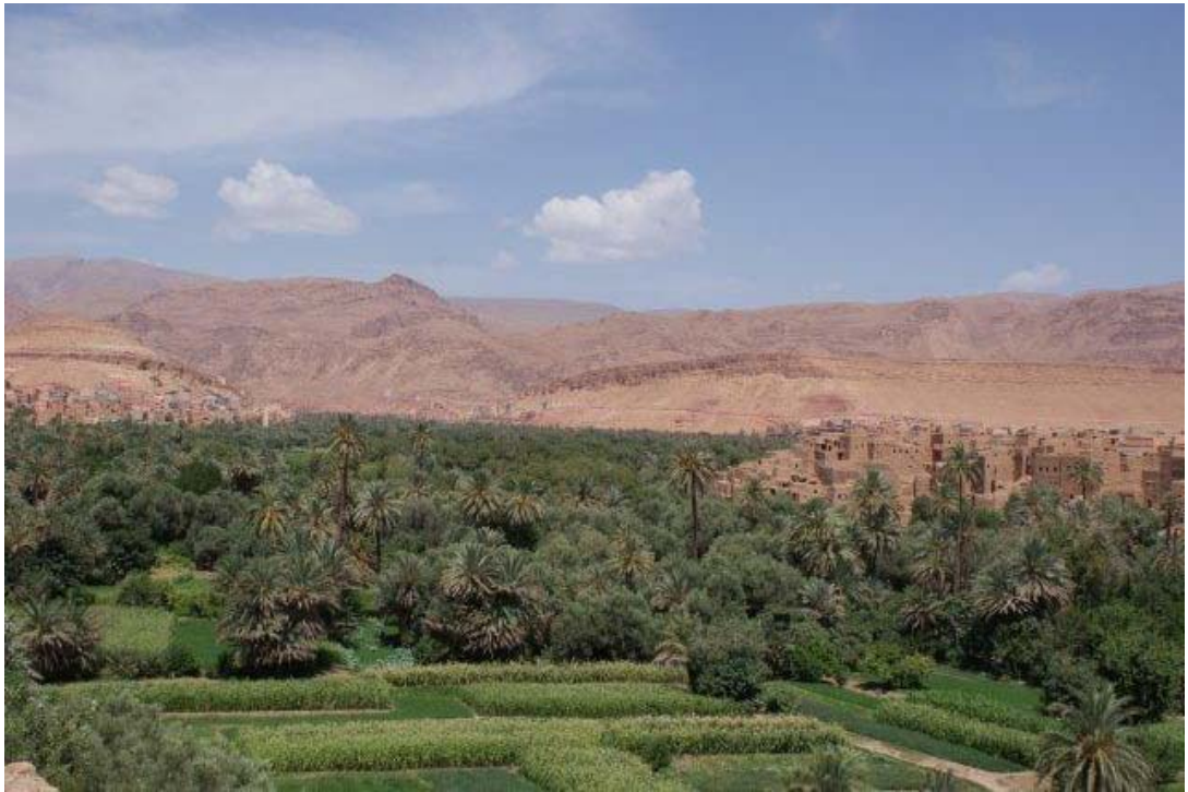
Dadelpalmen in de vruchtbare valleien aan de zuidkant van het Atlas gebergte.