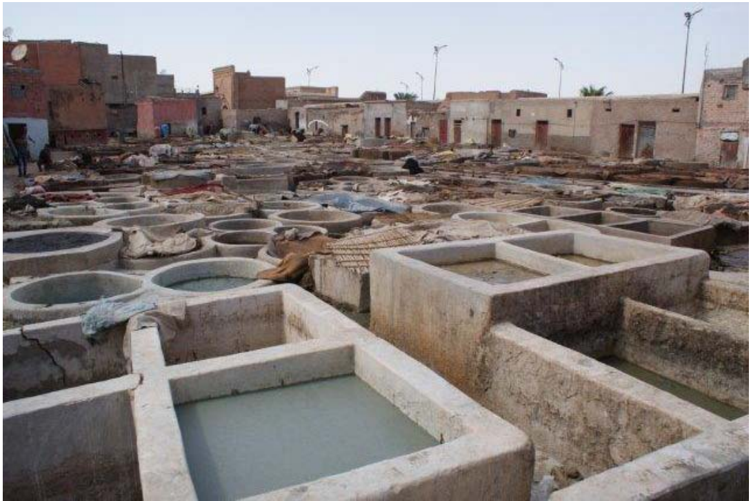
Een leerlooierij, de stank was hier bijna niet te harden..