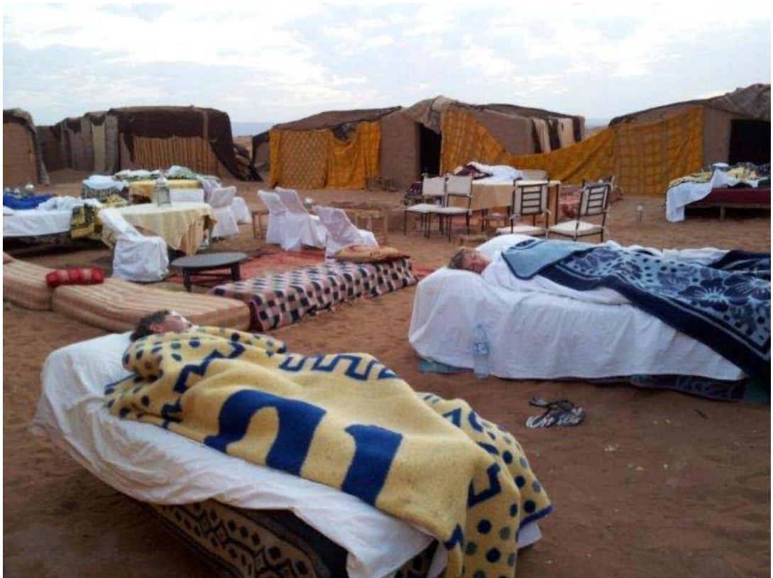
Een nacht slapen onder de sterrenhemel, een onvergetelijke ervaring!