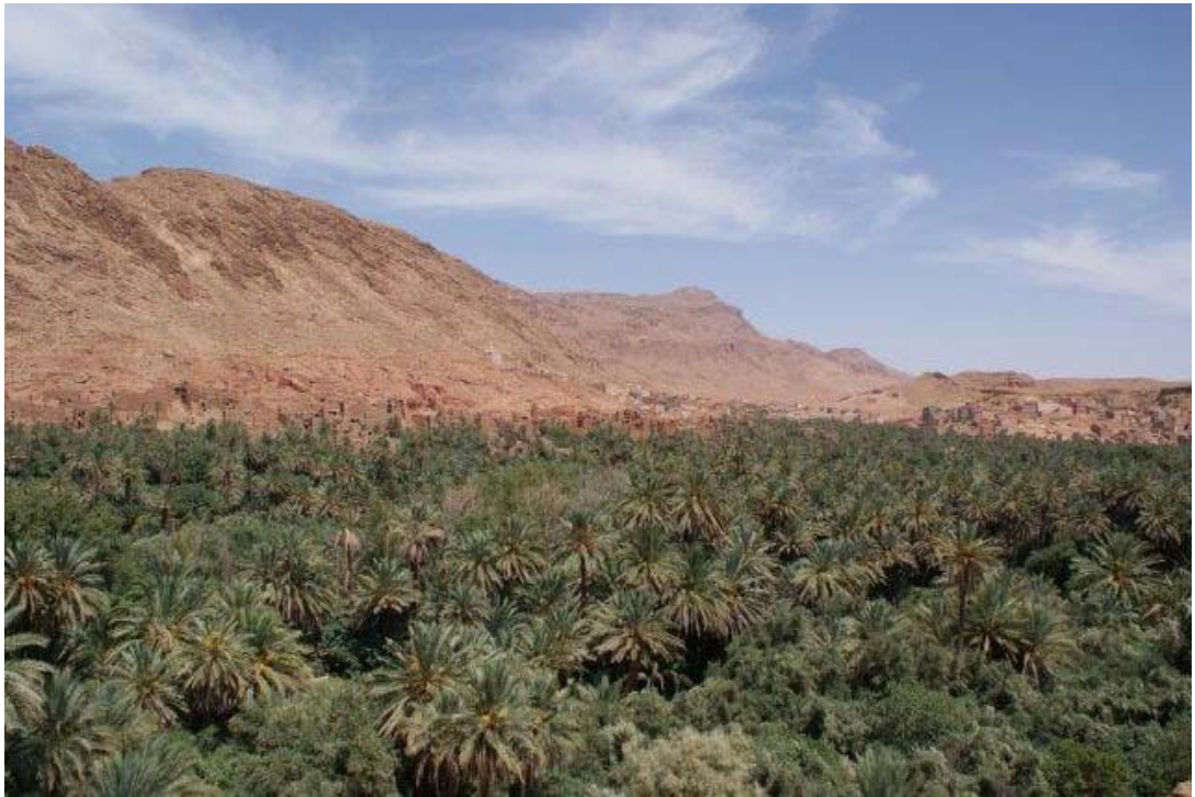
De Tohdra kloof in het Atlas gebergte.