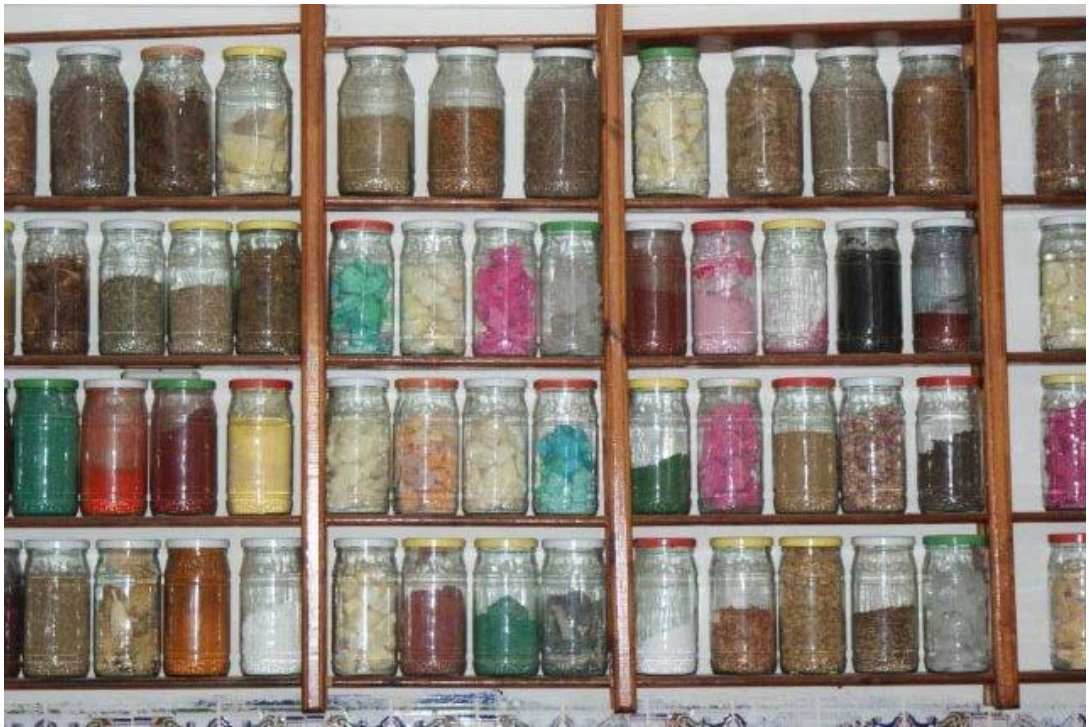
Een Marokkaanse "apotheek"