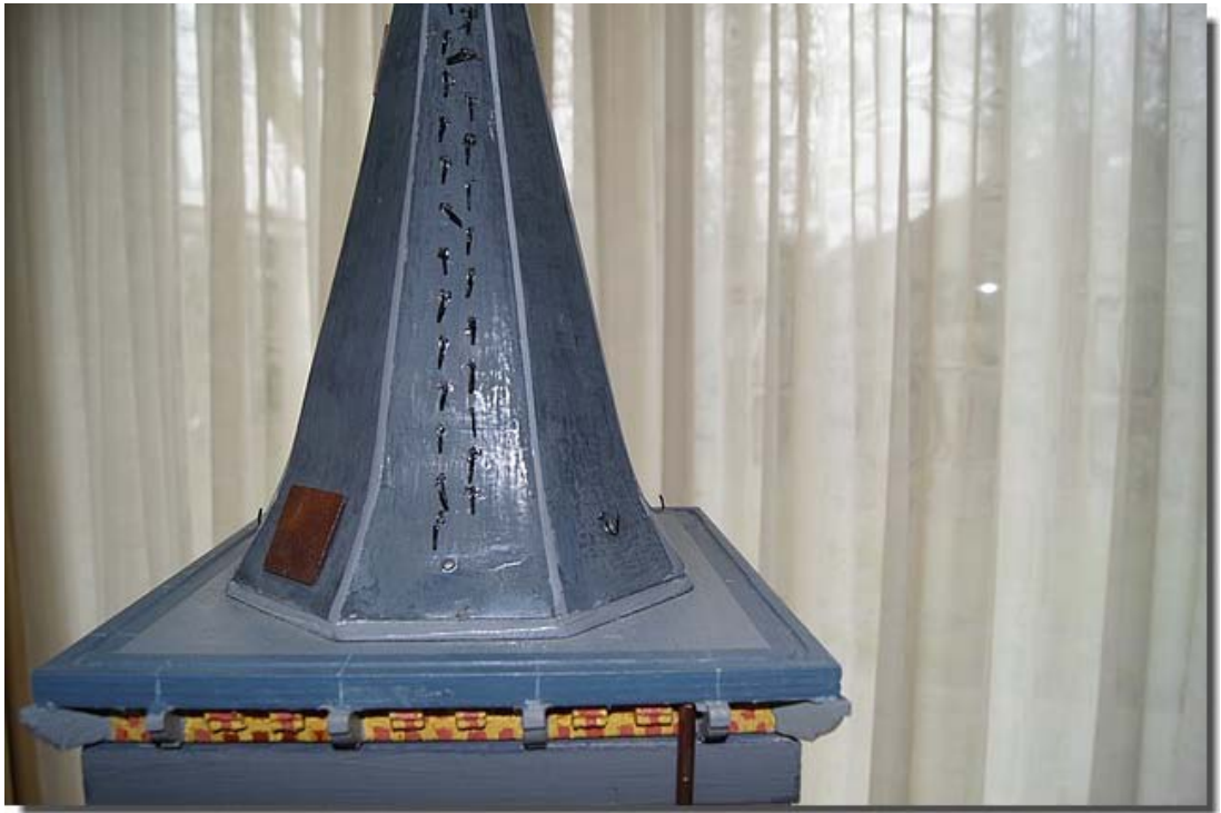
Zelfs op het dak is alles precies nageemaakt.