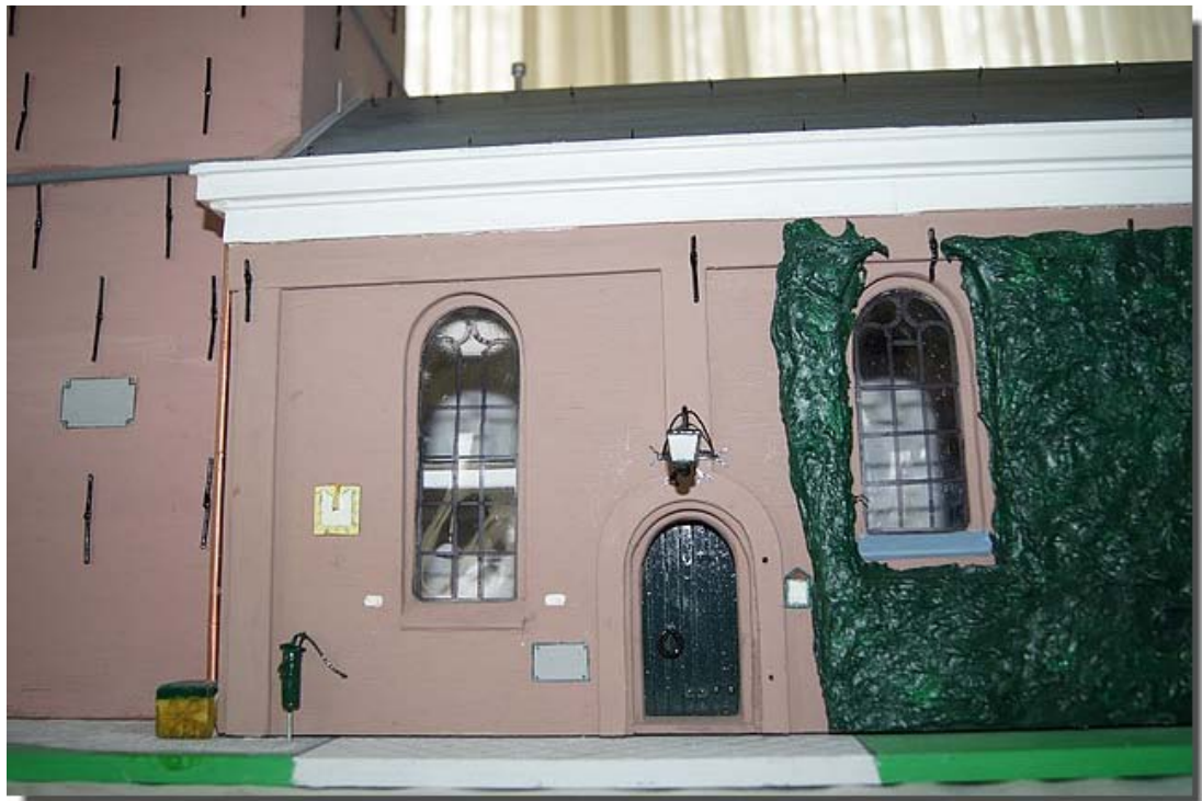
Details , zoals de waterput, zonnwijzer, alles is aanwezig.