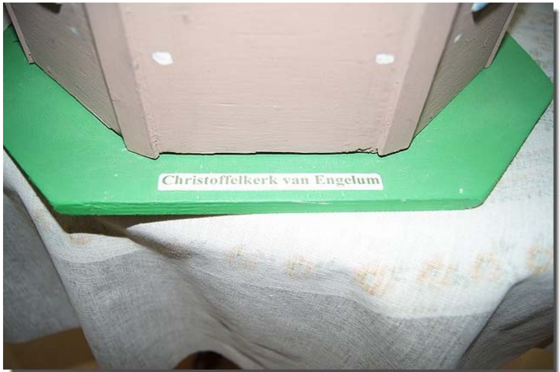
De originele naam is: Christoffelkerk