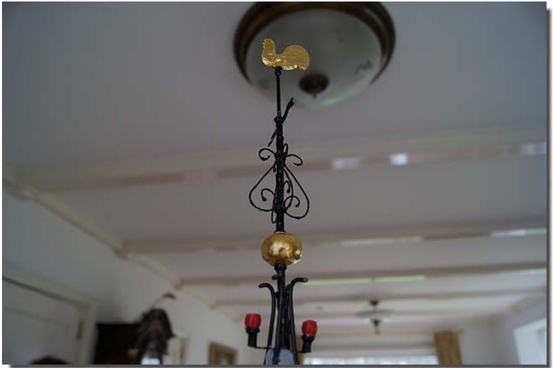
De haan in bladgoud.