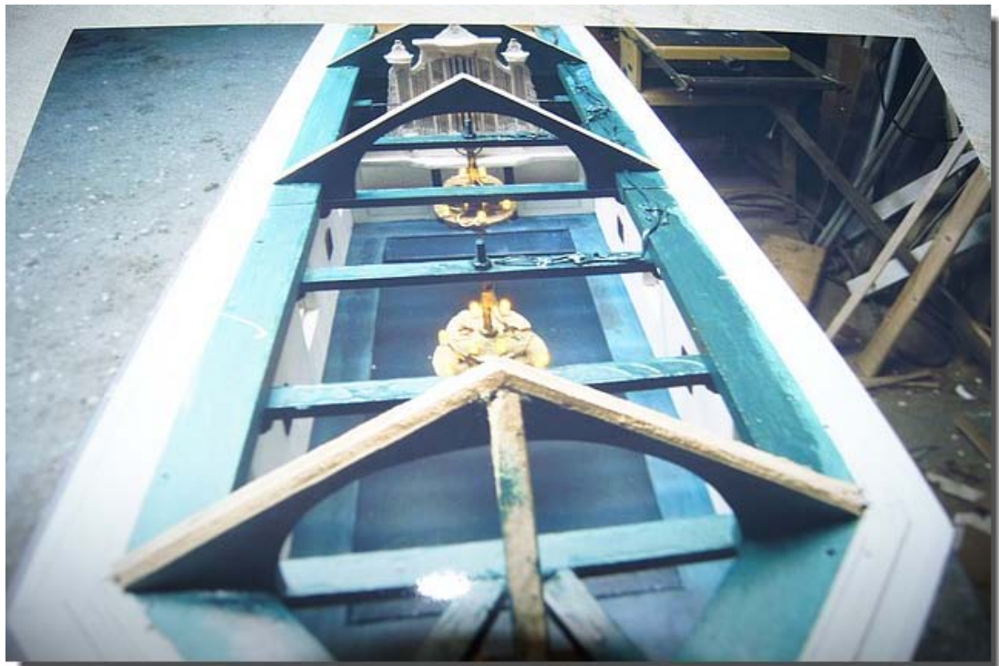
Hier de kerk van boven, zonder dak. Helemaal boven ziet u het orgel.