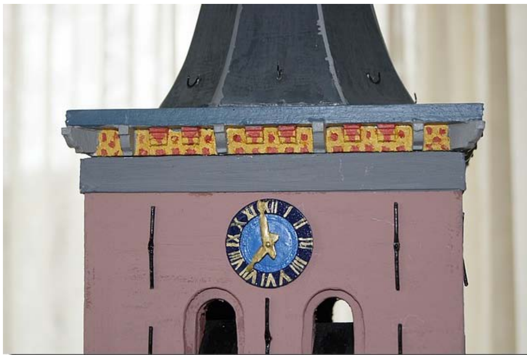
En natuurlijk het uurwerk.