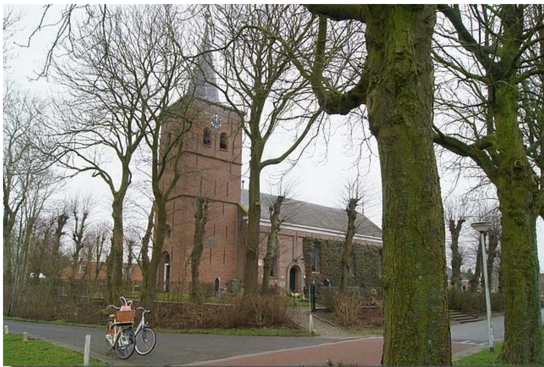
De tsjerke fan Ingelum, zoals wij hem allemaal kennen.

Begin pagina English page Engelum Geschiedenis Dorpsfoto's Kerkklokken Bewoners Dorpsbelang AED info Verenigingen Jeugdclub De oude doos Woningaanbod Sponsors K.v.Sla Raak Museum Fietsroute Links Archief Redactie E-mail Gastenboek