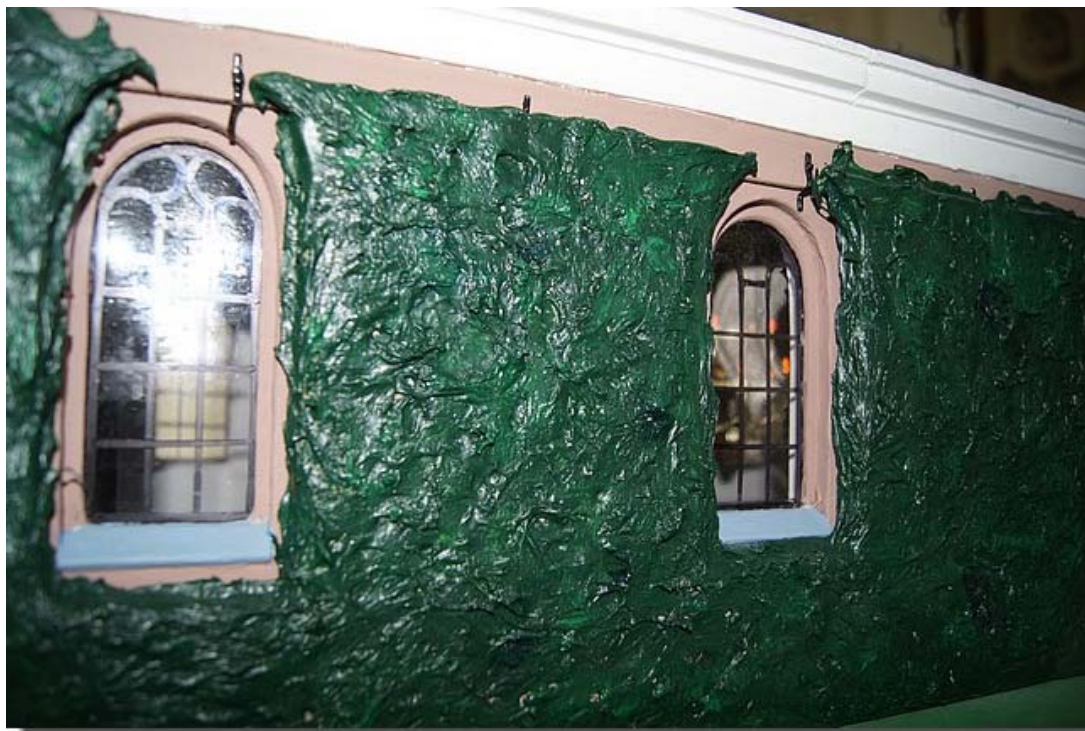
Ook de klimop bekend van de kraaiennesten ontbreekt niet.