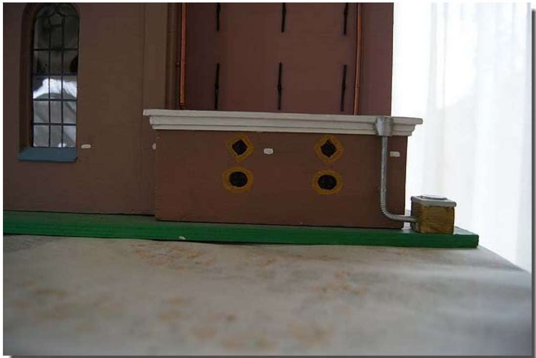
De achterkant van de kerk. De waterput welke nog steeds gebruikt kan worden voor het verzorgen van de bloemen en planten op het kerkhof.