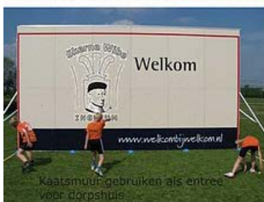
Kaatsmuur gebruiken als entree voor dorpshuis