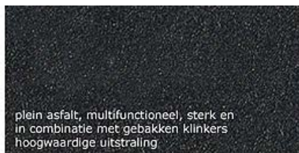
plein asfalt, multifunctioneel, sterk en in combinatie met gebakken klinkers hoogwaardige uitstraling