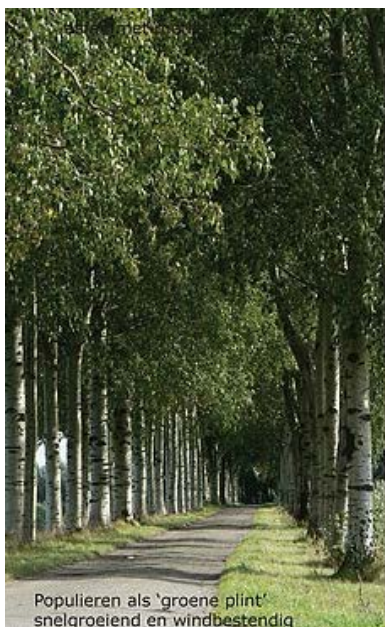
Populieren als 'groene plint' snelgroeiend en windbestendig