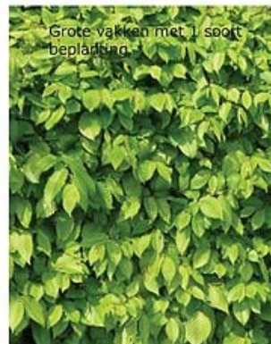
Grote vakken met 1 soort beplanting