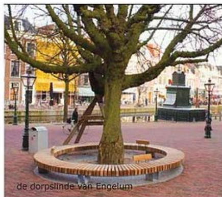
de dorpslinde van Engelum