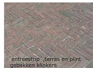
'entrestrip', terras en plint gebakken klinkers