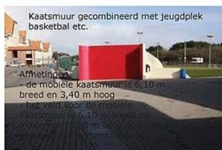
Kaatsmuur gecombineerd met jeugdplek basketbal etc.

Afmetingen - de mobiele kaatsmuur is 6,10 m breed en 3,40 m hoog - het veld voor de mobiele kaatsmuur is 6,10 m breed en 10,00 m lang