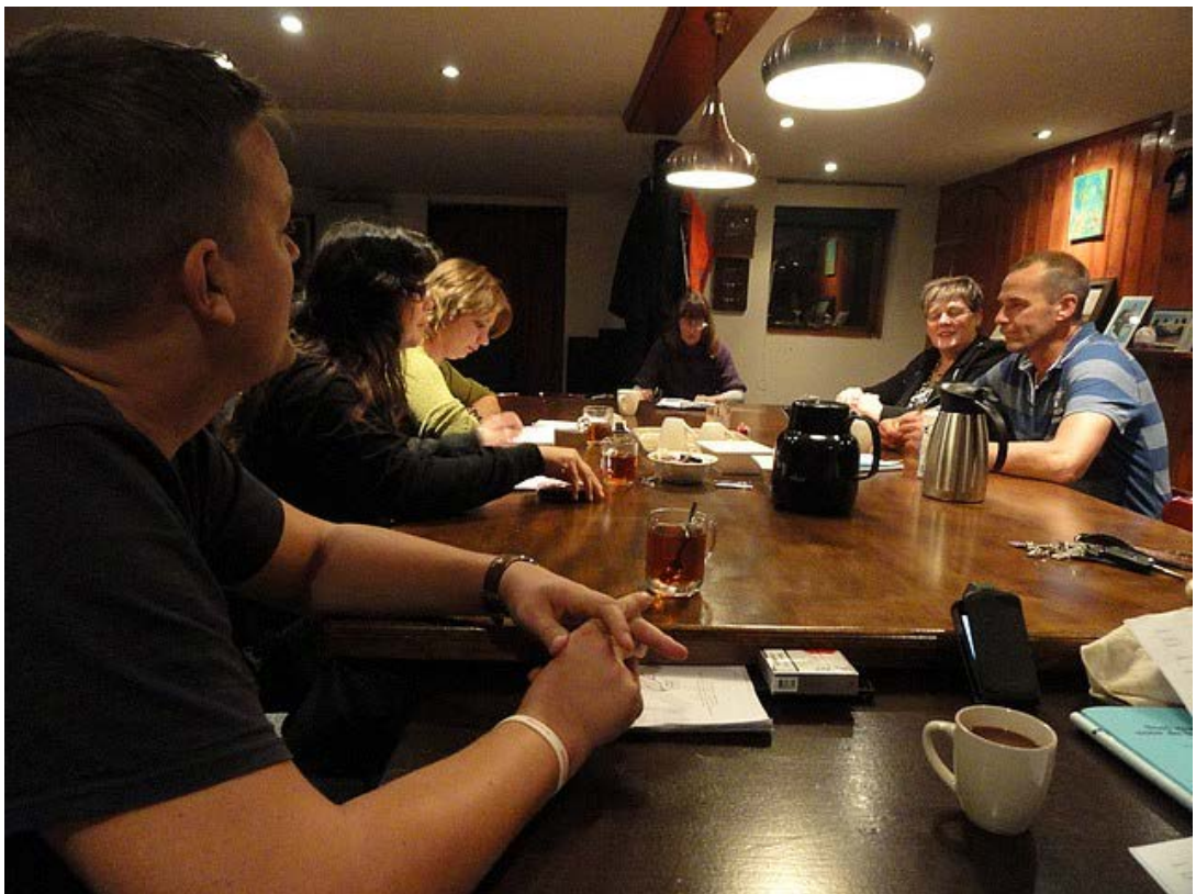
Ze repeteren daar alweer volop aan het nieuwe stuk 'Wat biine wy mooi fuort'.