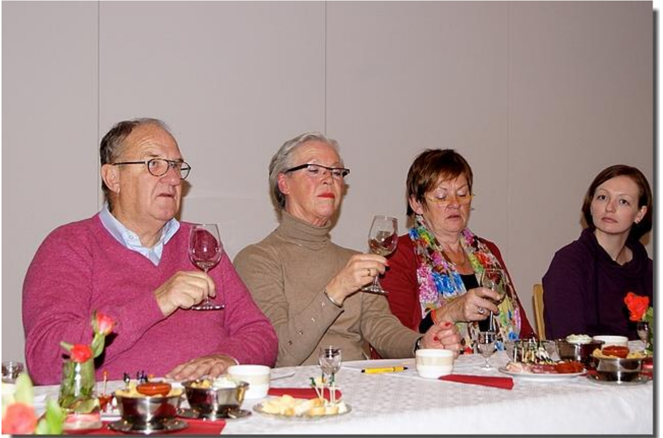
Kijken, ruiken en proeven.