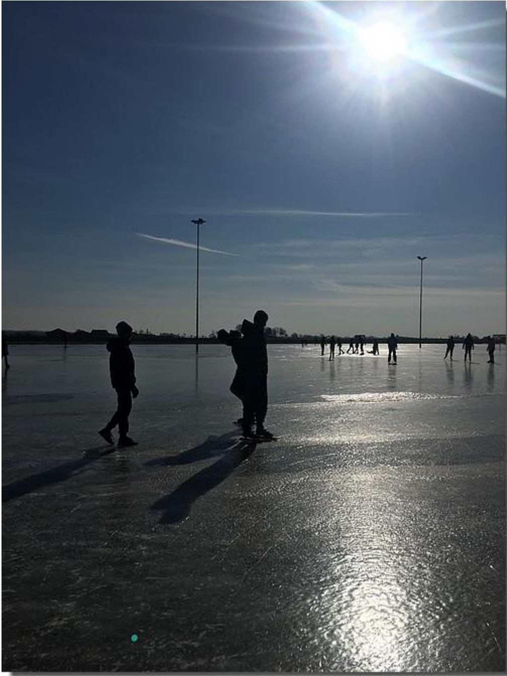
Al was het ijs wel wat hobbelig, de liefhebbers gingen het even proberen.