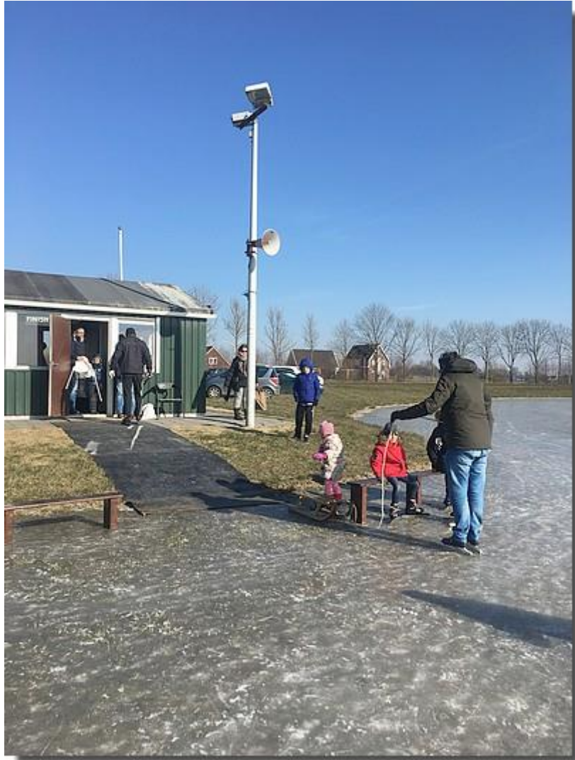
En ook de ijbaan was open.