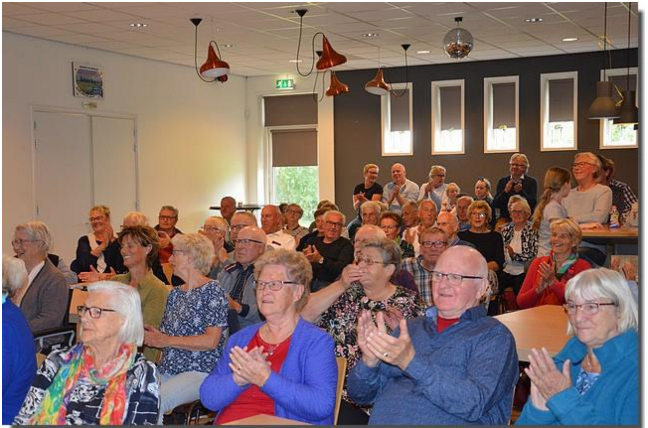
En het dorps huis was goed gevuld!