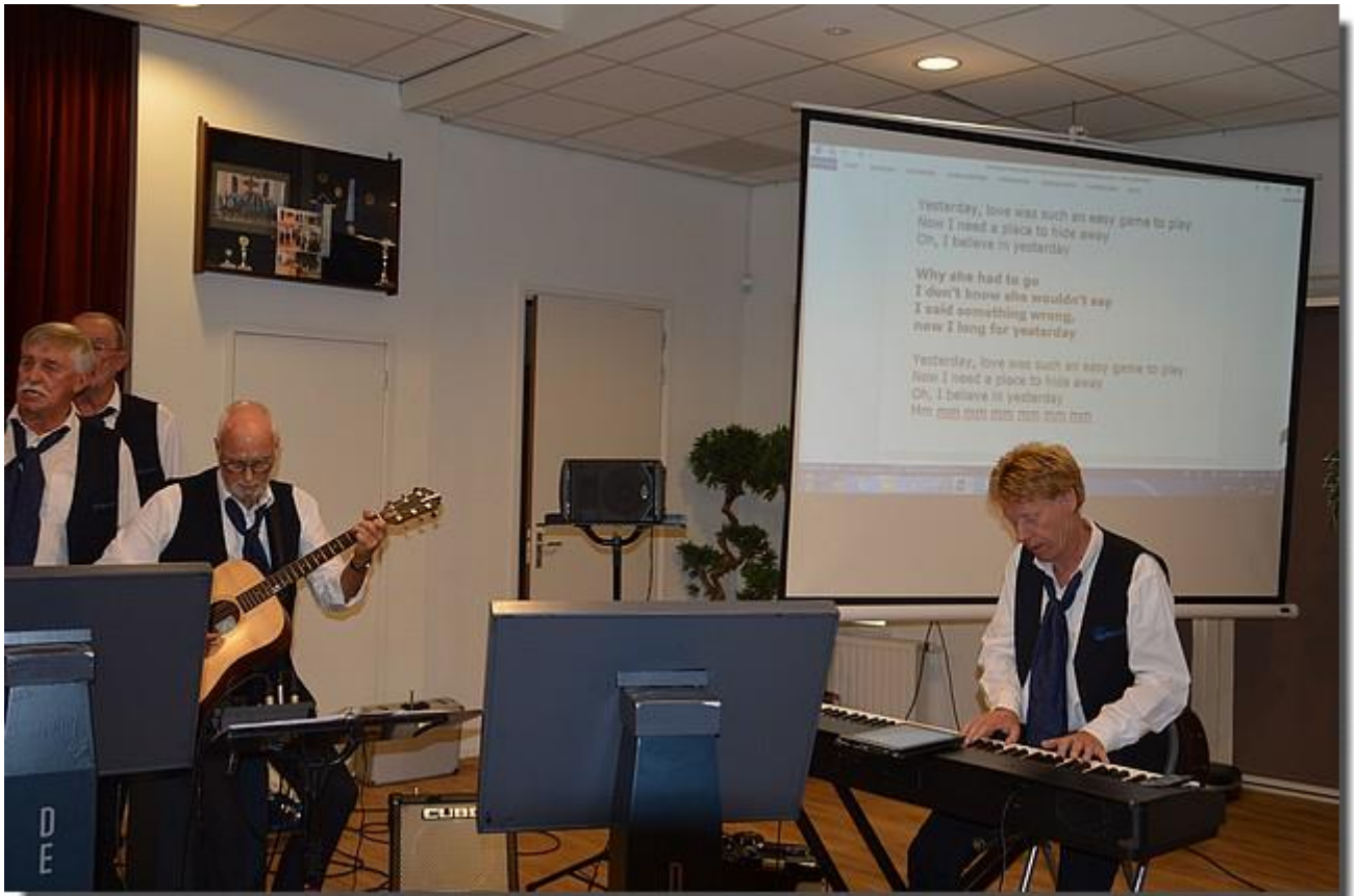
Op een groot scherm stond de tekst van de liedjes die mee konden worden gezongen.