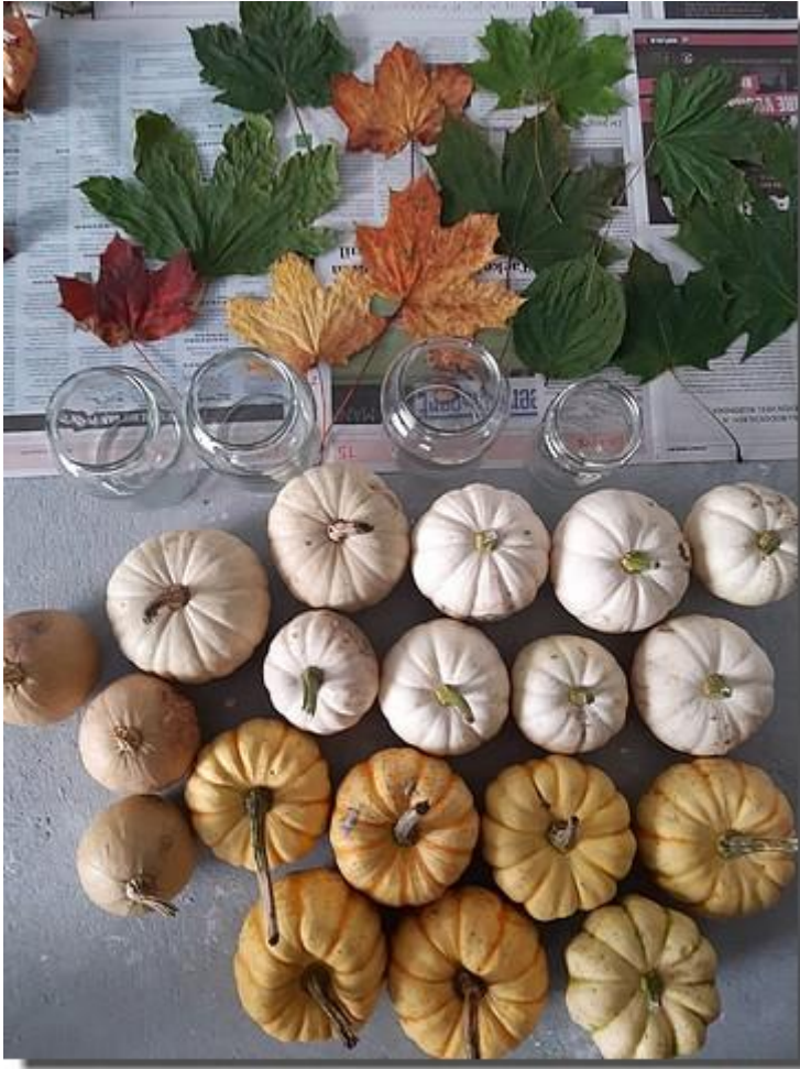
En ze gingen herfst knutselen.