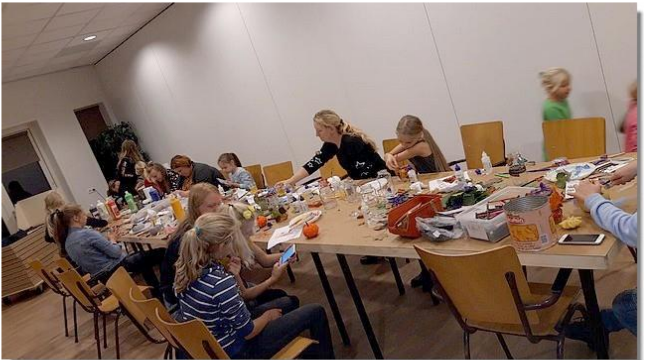
Er werden pompoenen beschilderd en leuke sfeerlichtjes gemaakt.