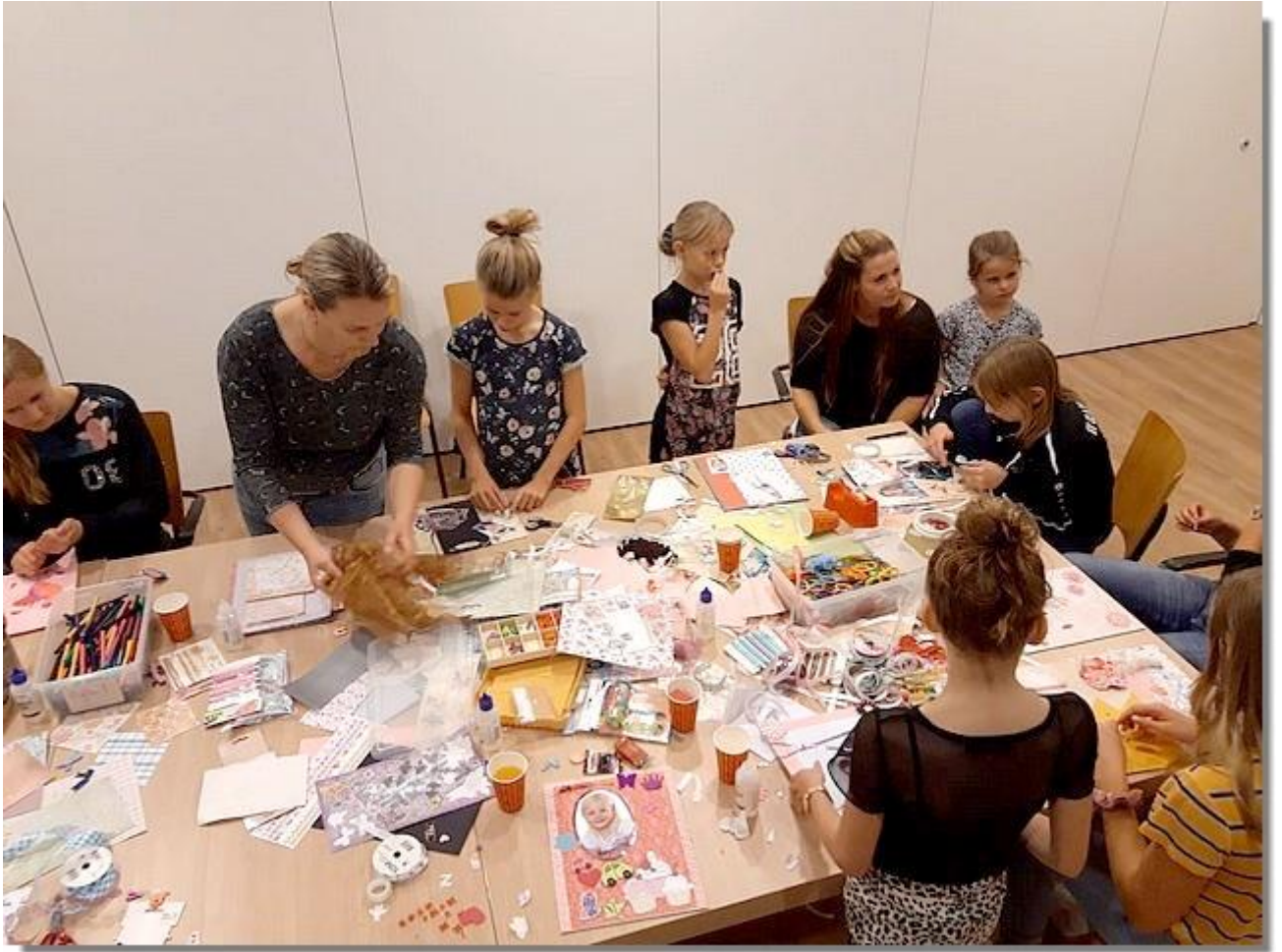
En knippen, plakken en kleuren.